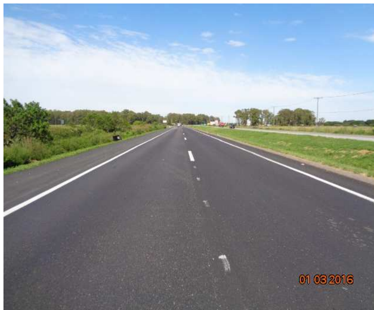
Figura 02 – Recuperação do Pavimento – BR-392/RS