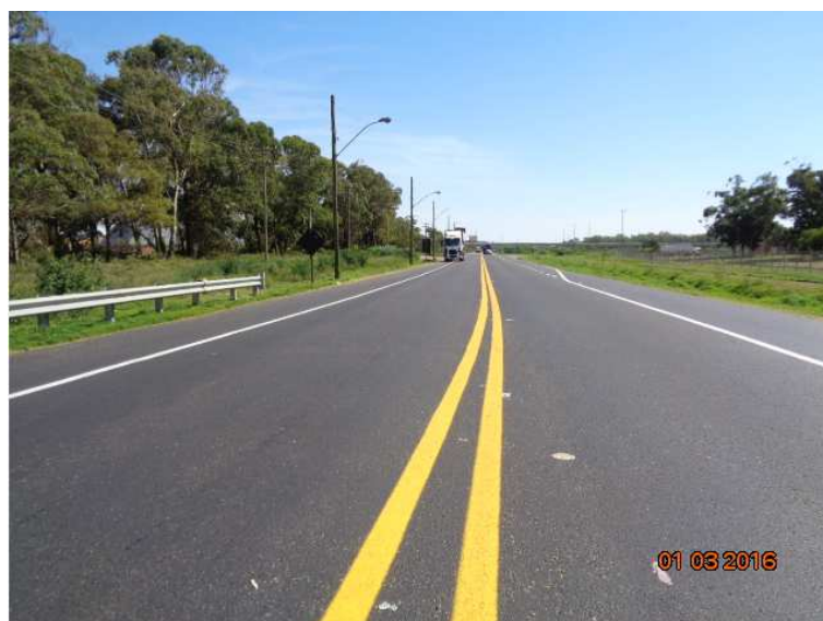
Figura 03 – Manutenção do Pavimento – BR-392/RS