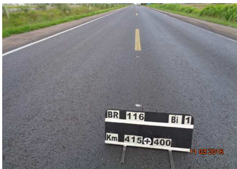
Figura 05 – Recuperação do Pavimento – BR-116/RS