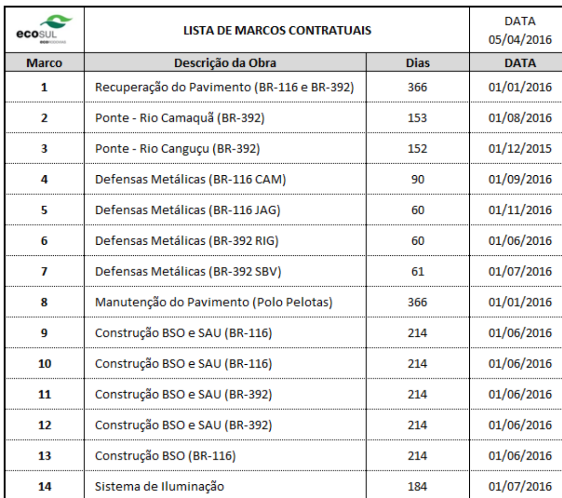
Tabela 03 – Lista de Marcos Contratuais