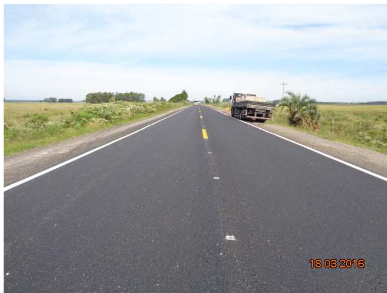
Figura 04 – Recuperação do Pavimento – BR-116/RS