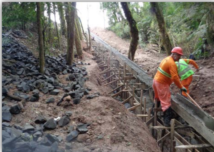
Figura 02 – Serra do Espigão – km 103,710 ao 103,755 (N)