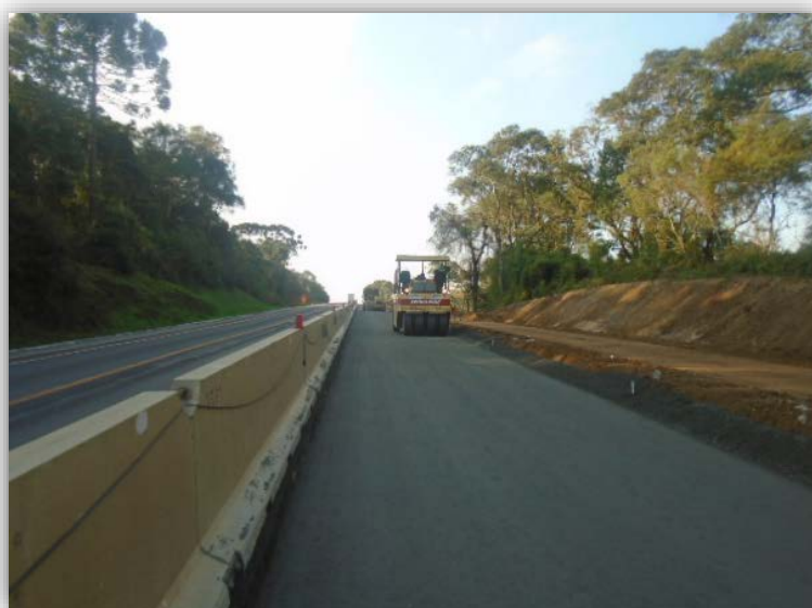
Figura 04 – Execução de Terceiras Faixas – km 015,105 ao 016,140