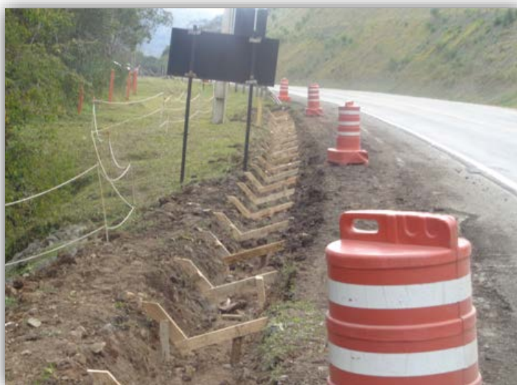
Figura 03 – Serra do Espigão – km 103,715 ao 103,880 (S)