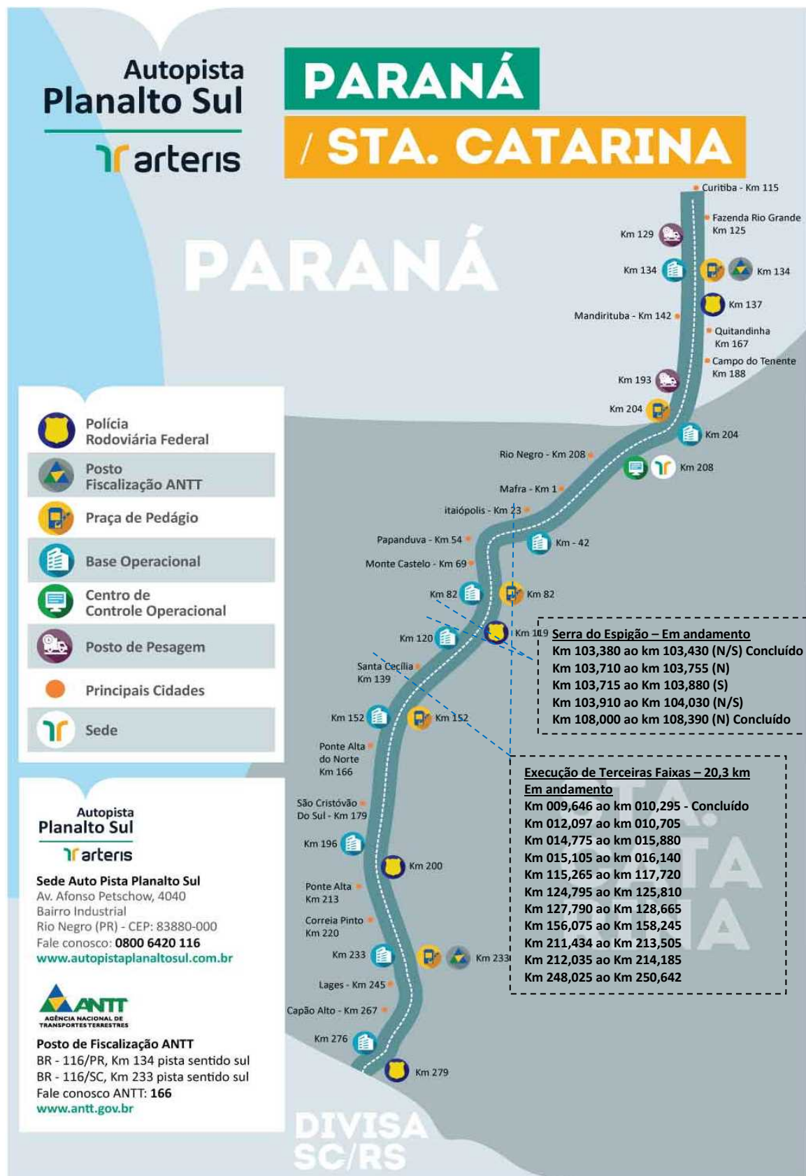
Figura 01 – Mapa de Situação