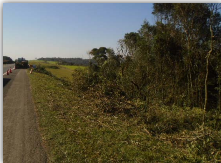
Figura 09 – Execução de Terceiras Faixas – km 211,434 ao 213,505