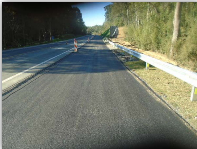
Figura 02 – Execução de Terceiras Faixas – km 012,097 ao 010,705