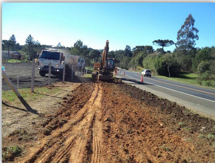
Figura 07 – Execução de Terceiras Faixas – km 127,790 ao 128,665