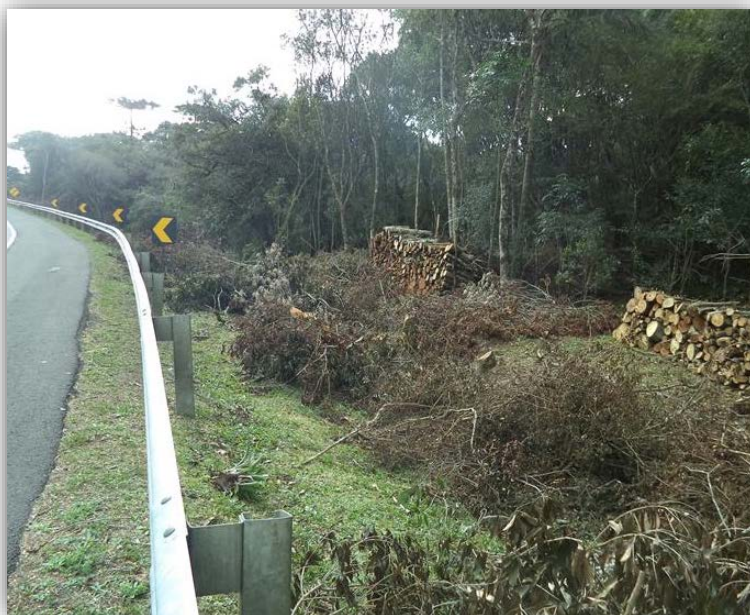
Figura 08 – Execução de Terceiras Faixas – km 156,075 ao 158,245