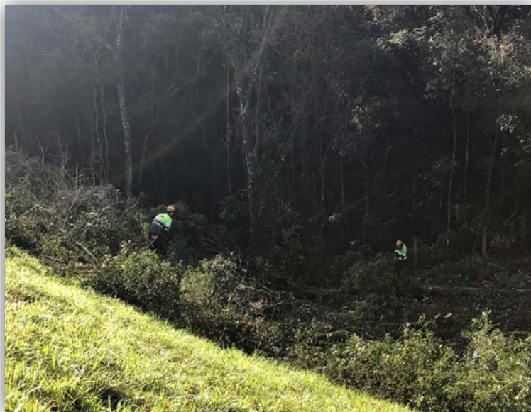
Figura 11 – Execução de Terceiras Faixas – km 248,025 ao 250,642