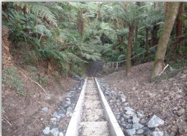
Figura 04 – Serra do Espigão – km 103,910 ao 104,030 (N/S)