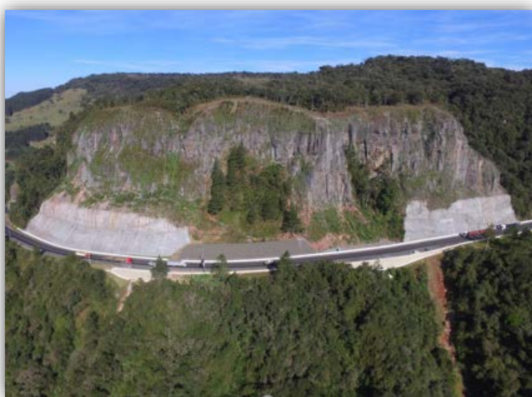
Figura 05 – Serra do Espigão – km 108,000 ao 108,390 (N) - Concluído