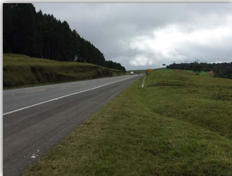
Figura 10 – Execução de Terceiras Faixas – km 212,035 ao 214,185