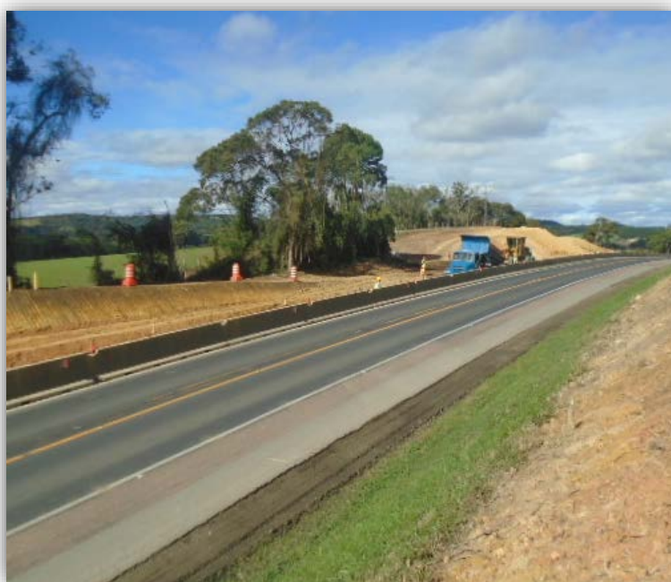
Figura 06 – Execução de Terceiras Faixas – km 124,795 ao 125,810