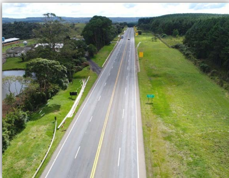
Figura 05 – Execução de Terceiras Faixas – km 115,265 ao 117,720