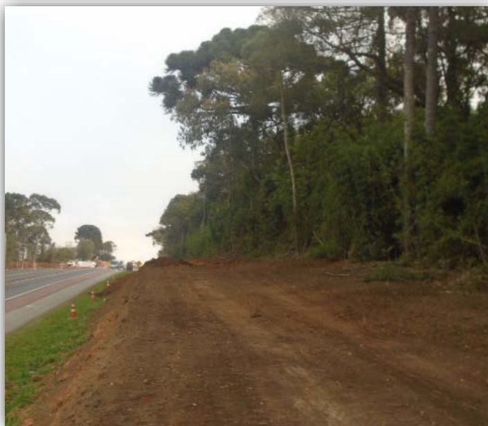
Figura 03 – Execução de Terceiras Faixas – km 014,775 ao 015,880