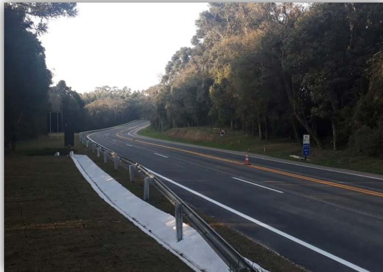
Figura 01 – Execução de Terceiras Faixas – km 009,646 ao 010,295 - Concluído