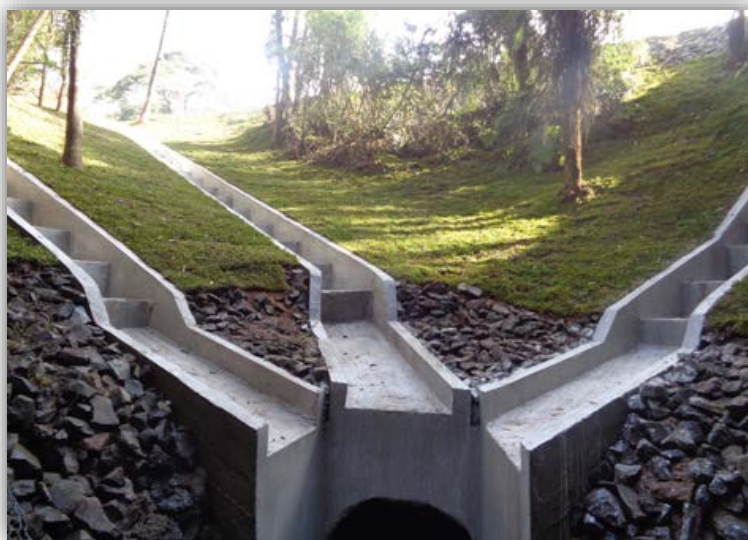
Figura 01 – Serra do Espigão – km 103,380 ao 103,430 (N/S) - Concluído