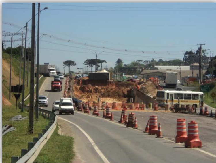
Figura 01 – Trevo em Desnível – BR-116/SC km 004,500