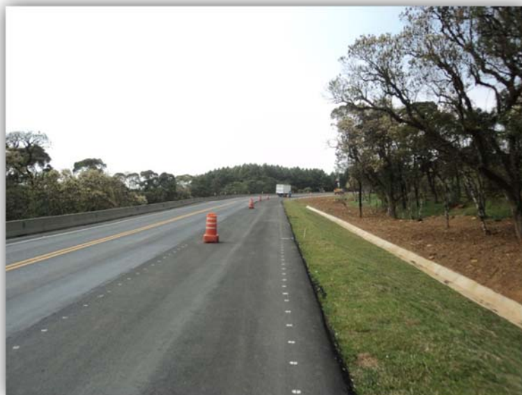
Figura 01 – Execução de Terceiras Faixas – km 114,580 ao 116,300