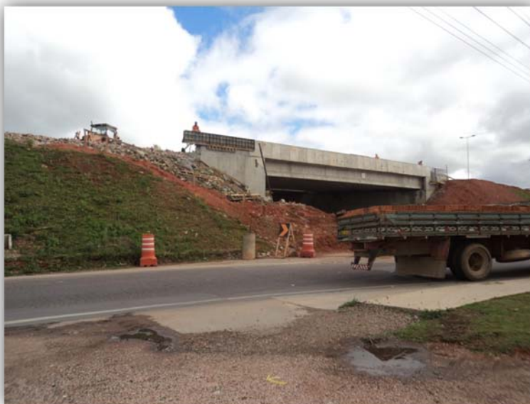
Figura 01 – Trevos em Desnível, com Alças, em pista Dupla - BR-116/PR km 127,500 Fazenda Rio Grande