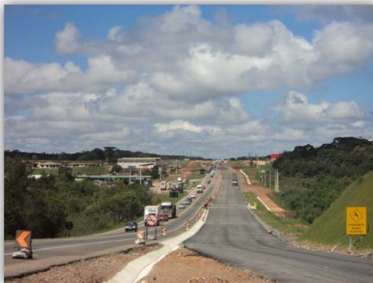
Figura 03 – Duplicação (Inclusive OAE) KM 124,560 ao KM 142,700