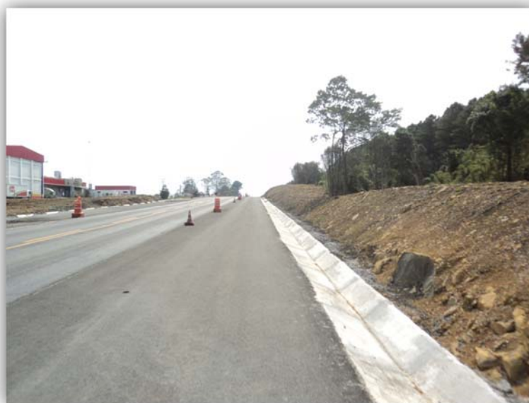
Figura 02 – Execução de Terceiras Faixas – km 115,260 ao 117,720