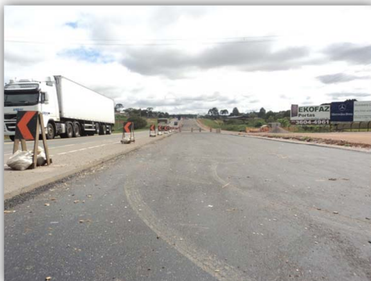
Figura 04 – Duplicação (Inclusive OAE) KM 124,560 ao KM 142,700