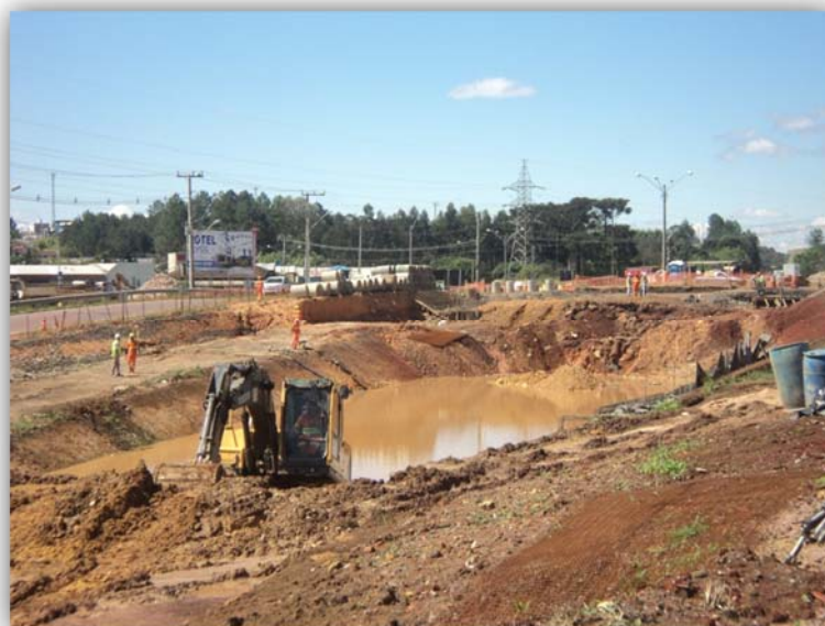
Figura 02 – Trevo em Desnível – BR-116/SC km 004,500