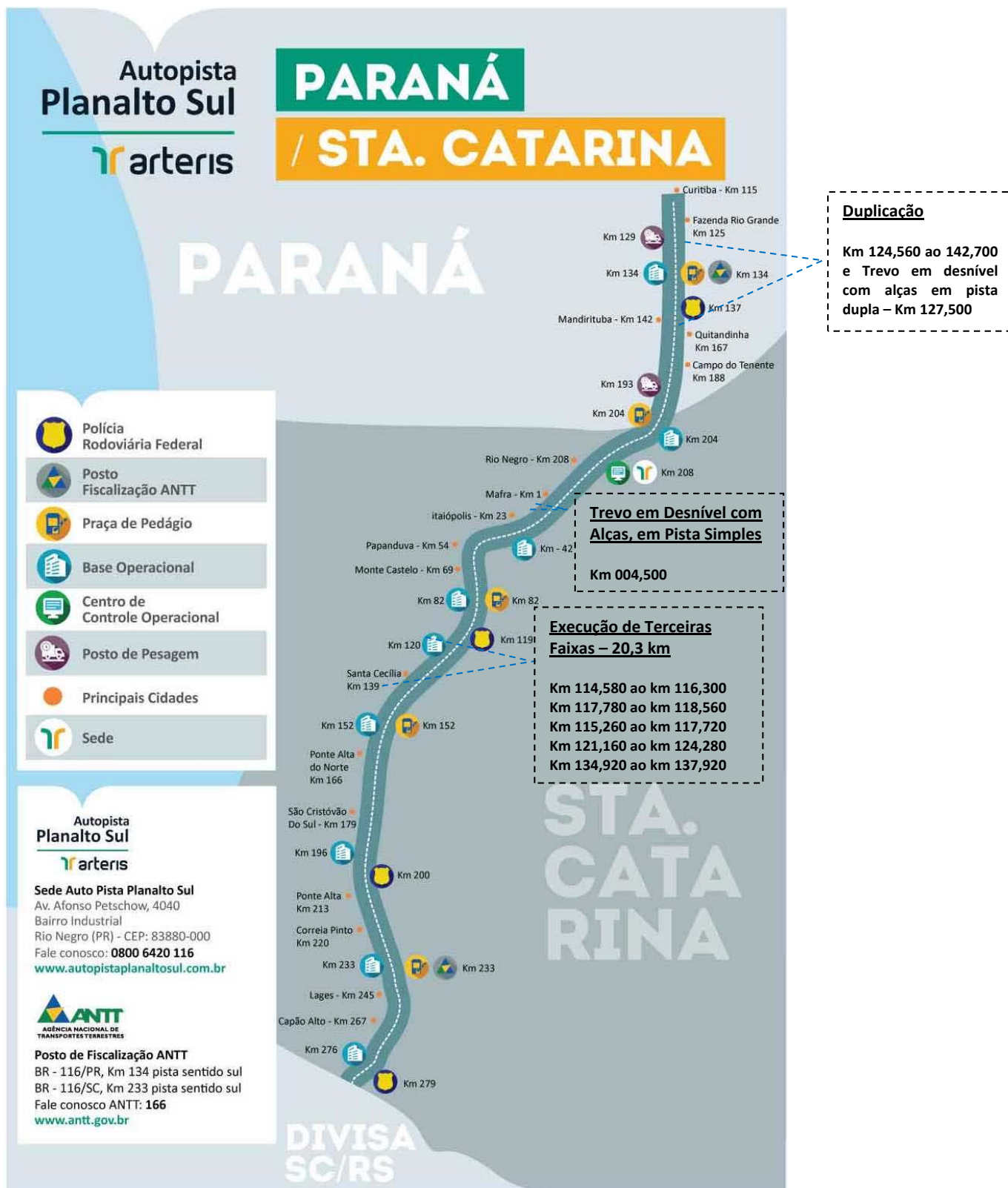
Figura 01 – Mapa de Situação