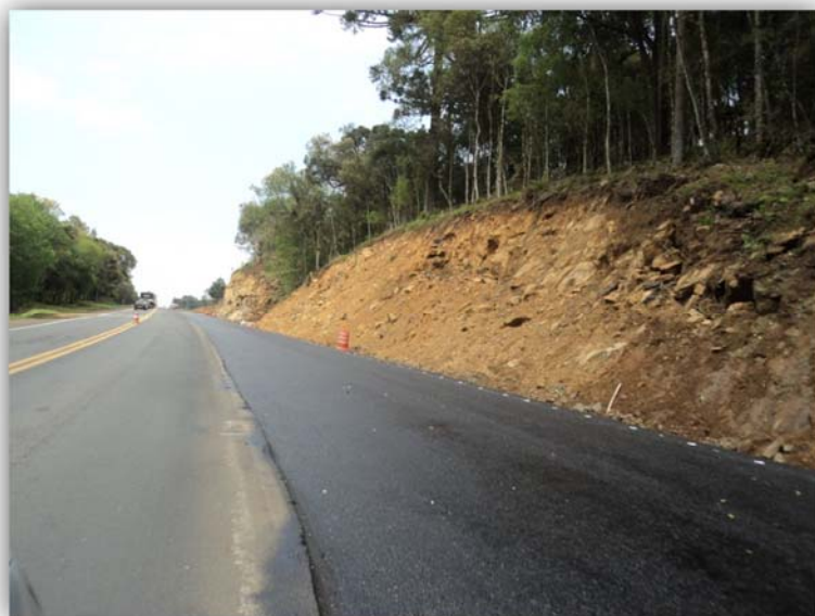
Figura 05 – Execução de Terceiras Faixas – km 134,920 ao 137,920