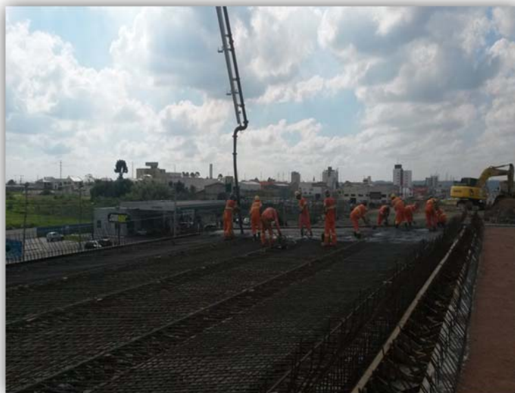
Figura 03 – Trevos em Desnível, com Alças, em pista Dupla - BR-116/PR km 127,500 Fazenda Rio Grande