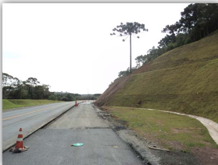
Figura 04 – Execução de Terceiras Faixas – km 121,160 ao 124,280