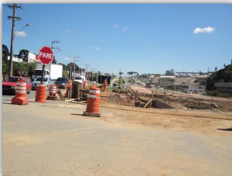
Figura 04 – Trevo em Desnível – BR-116/SC km 004,500