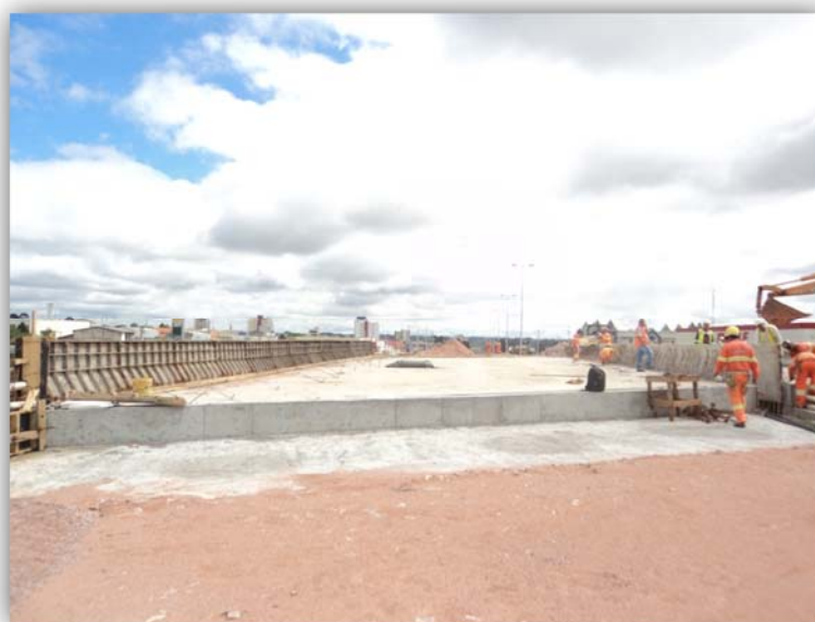
Figura 04 – Trevos em Desnível, com Alças, em pista Dupla - BR-116/PR km 127,500 Fazenda Rio Grande