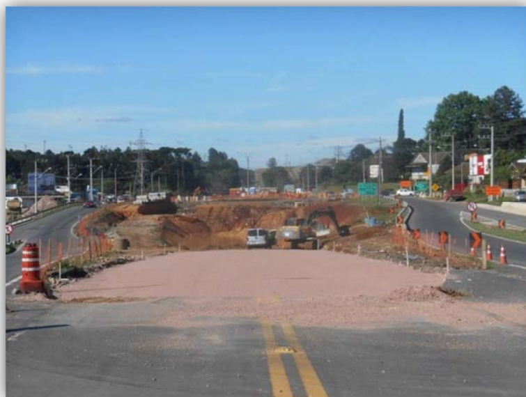
Figura 03 – Trevo em Desnível – BR-116/SC km 004,500