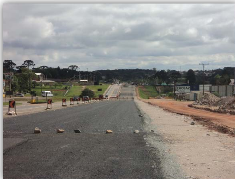
Figura 01 – Duplicação (Inclusive OAE) KM 124,560 ao KM 142,700