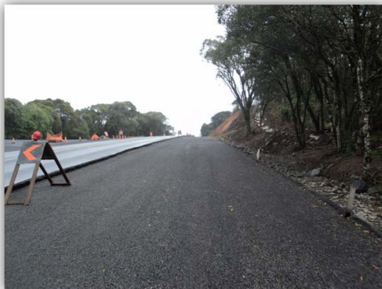
Figura 03 – Execução de Terceiras Faixas – km 117,800 ao 118,565