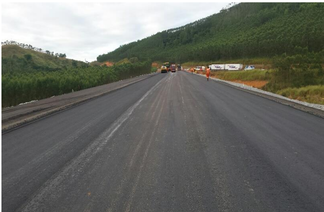
Figura 05 – CGT e TF – km 146+600 ao km 146+900