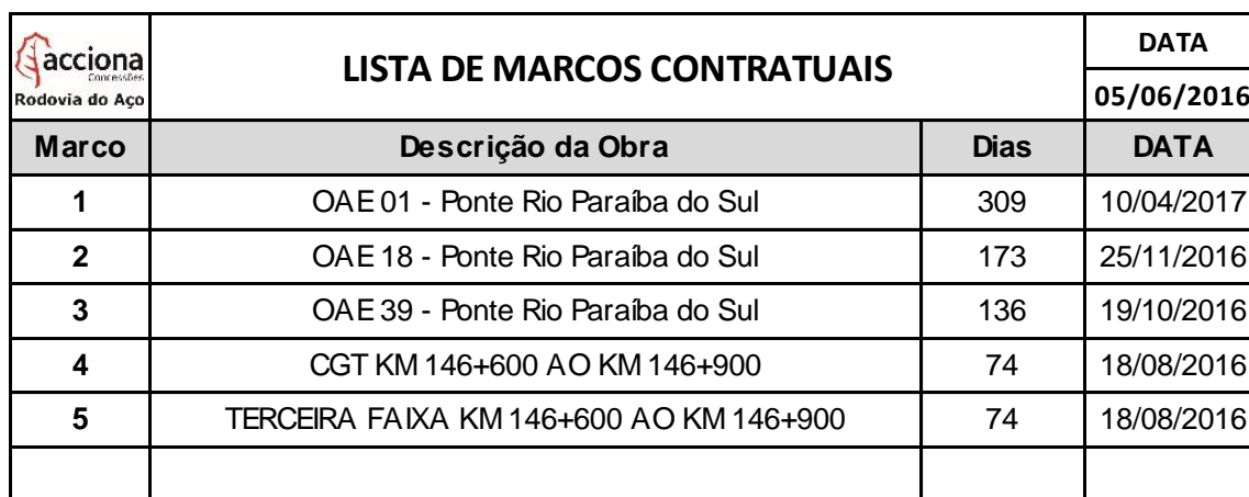
Tabela 03 – Lista de Marcos Contratuais