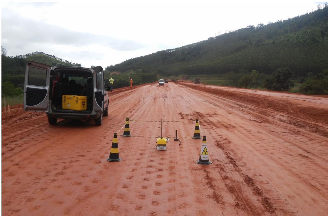
Figura 01 – CGT e TF – km 146+600 ao km 146+900