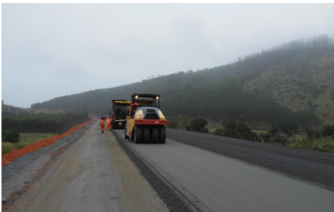
Figura 04 – CGT e TF – km 146+600 ao km 146+900