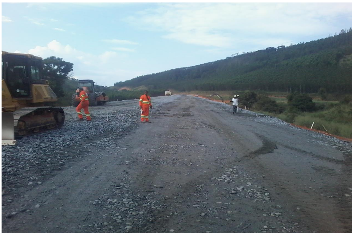
Figura 03 – CGT e TF – km 146+600 ao km 146+900