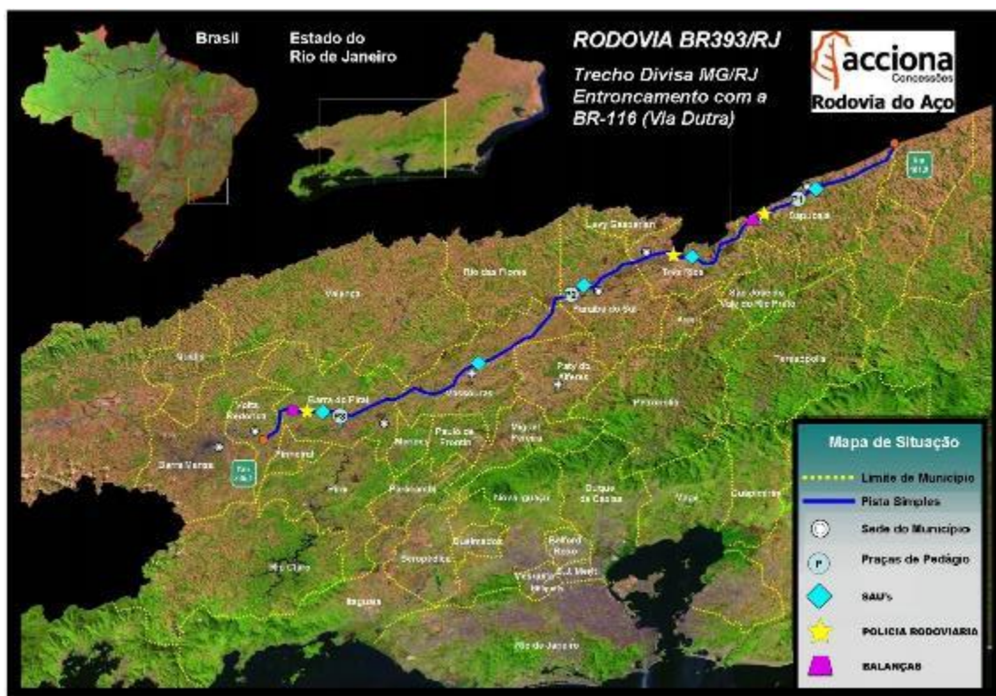
Figura 01 – Mapa de Situação