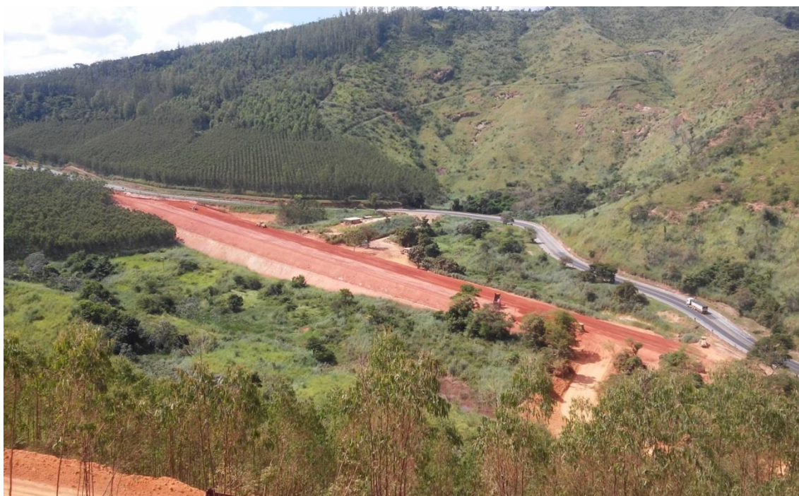
Figura 02 – CGT e TF – km 146+600 ao km 146+900