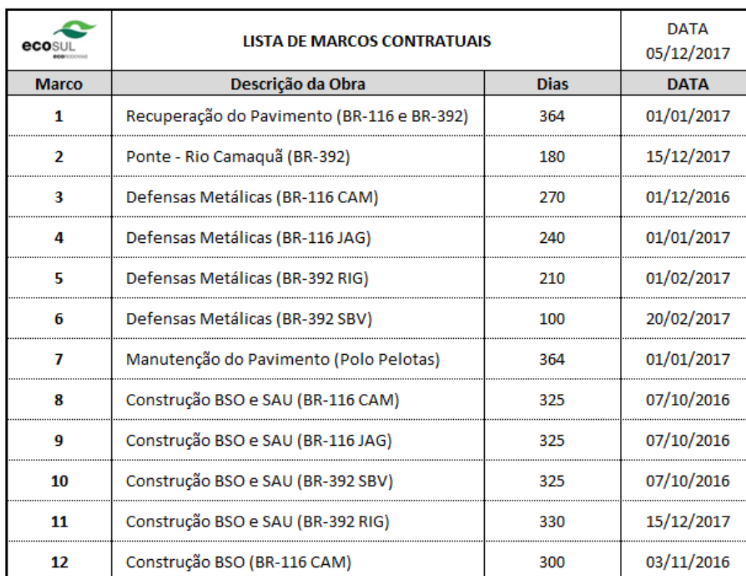
Tabela 03 – Lista de Marcos Contratuais