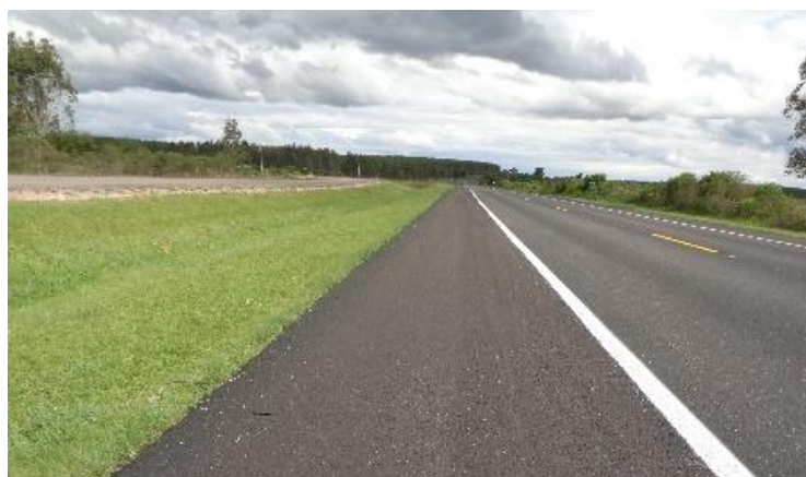
Figura 03 – Recomposição de acostamentos BR-116 km 469+000 ao 508+000