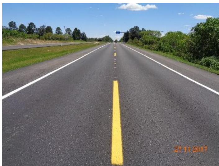
Figura 02 – Serviços de recuperação do pavimento BR-116 km 505+400 ao 508+700