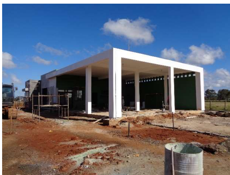
Figura 03 – Construção Bases Operacionais BR-116 km 524+000 LD