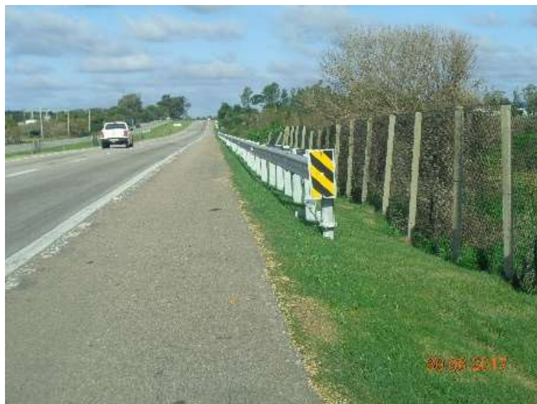
Figura 06 – Implantação defensas metálicas BR-392