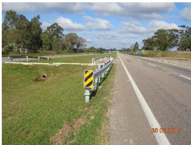
Figura 07 – Implantação defensas metálicas BR-392