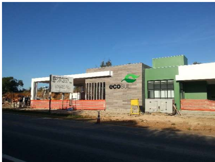
Figura 04 – Construção Bases Operacionais BR-116 km 607+000 LE