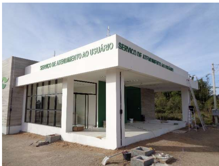
Figura 02 – Construção Bases Operacionais BR-116 km 492+000 LE