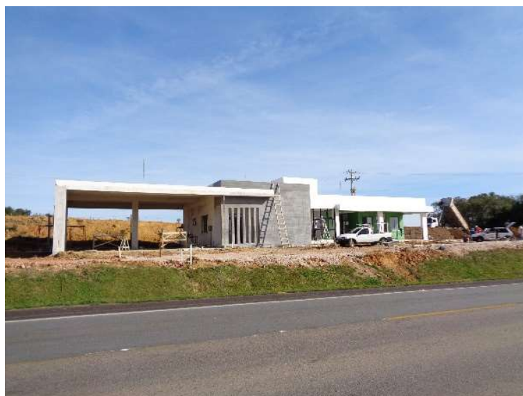
Figura 05 – Construção Bases Operacionais BR-116 km 125+700 LE