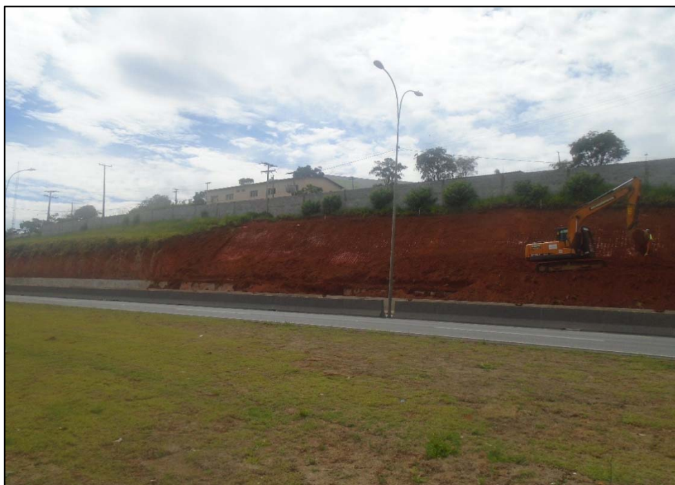
Figura 04 – Vista da obra