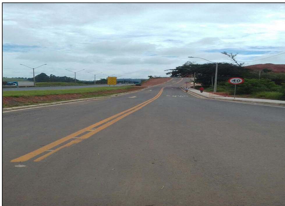
Figura 06 – Sinalização horizontal