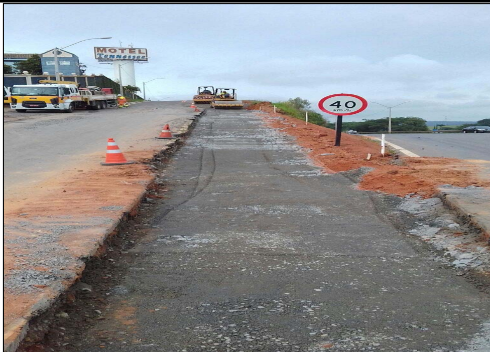
Figura 05 – Execução de base