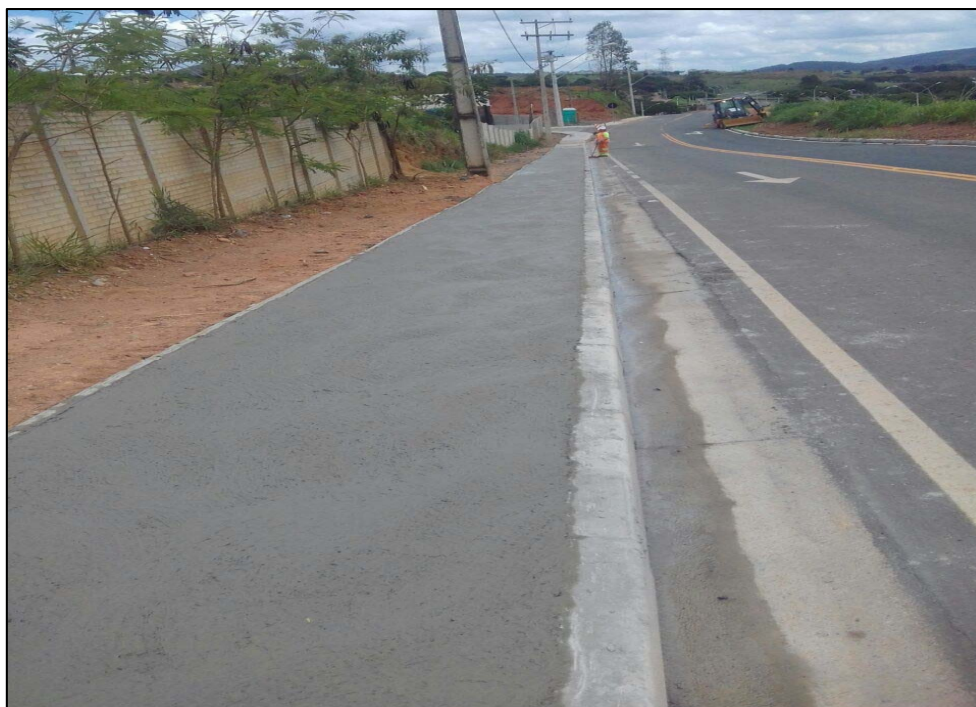
Figura 02 – Execução de calçada