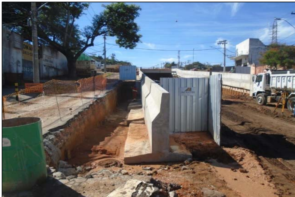
Figura 01 – Muros de arrimo