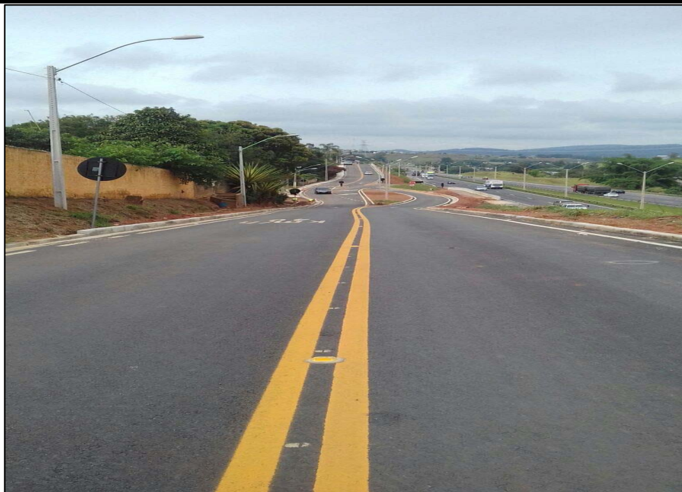
Figura 03 – Sinalização horizontal