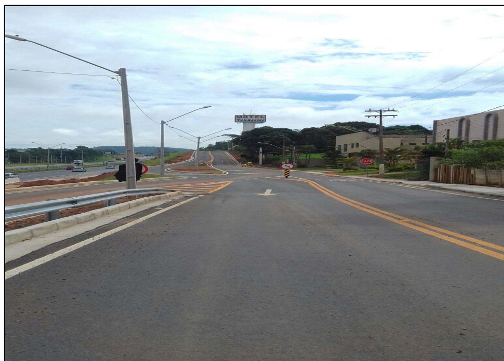
Figura 04 – Sinalização horizontal