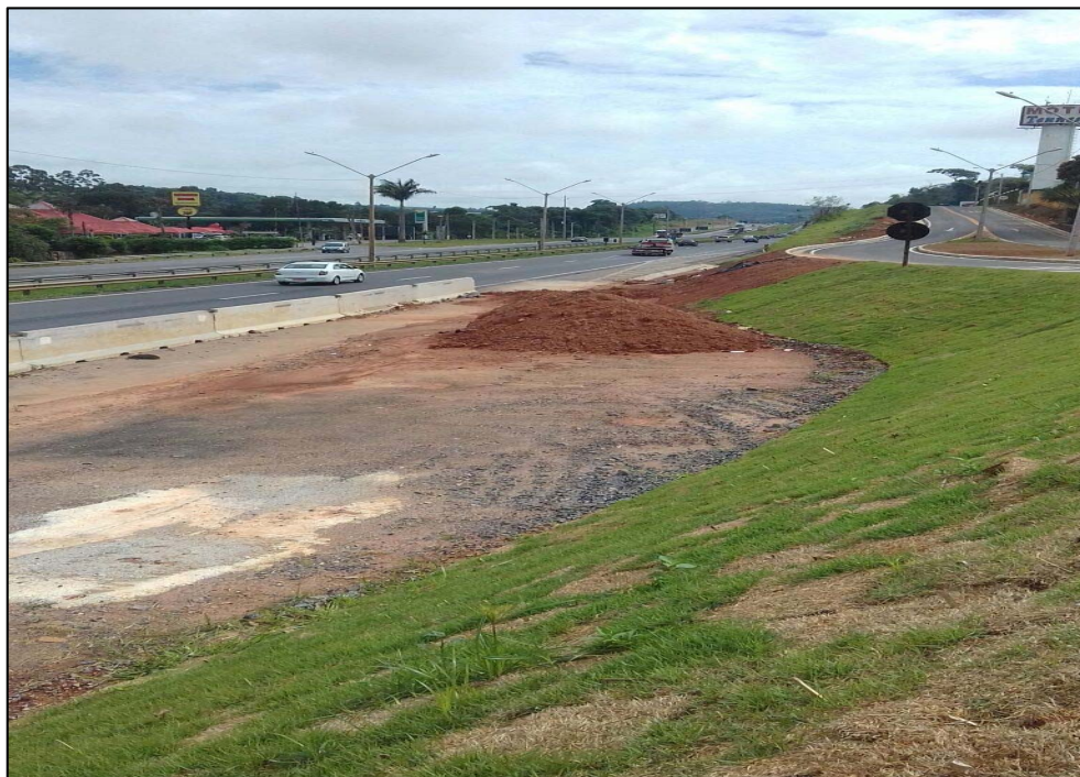
Figura 01 – Vista da obra