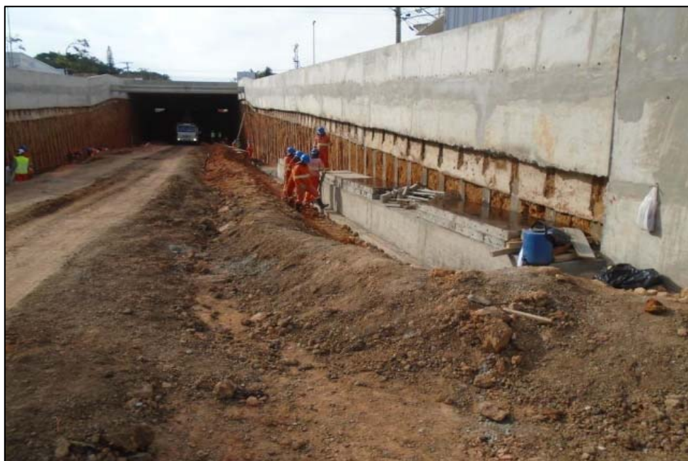
Figura 06 Vigas laterais inferiores