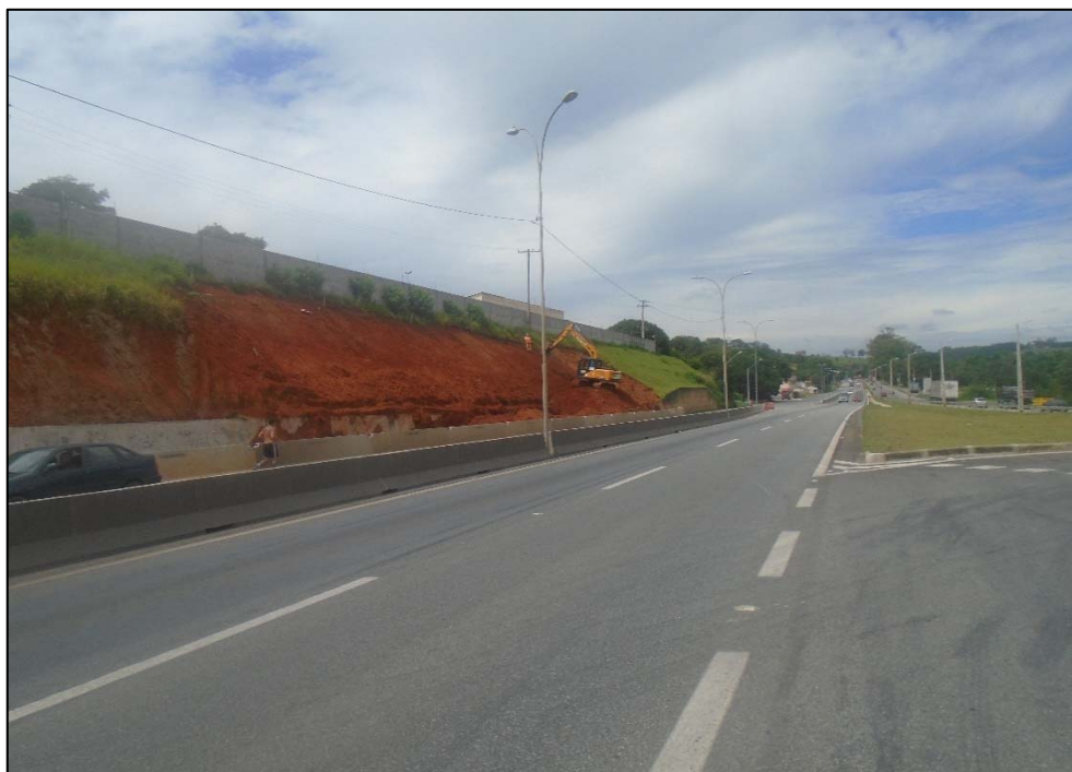
Figura 01 – Vista da obra

ADEQUAÇÃO DO SISTEMA VIÁRIO DO POSTO FISCAL / DISTRITO INDUSTRIAL DE EXTREMA NO KM 949+000.