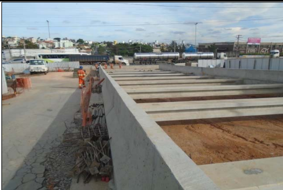
Figura 03 – Estroncas superiores