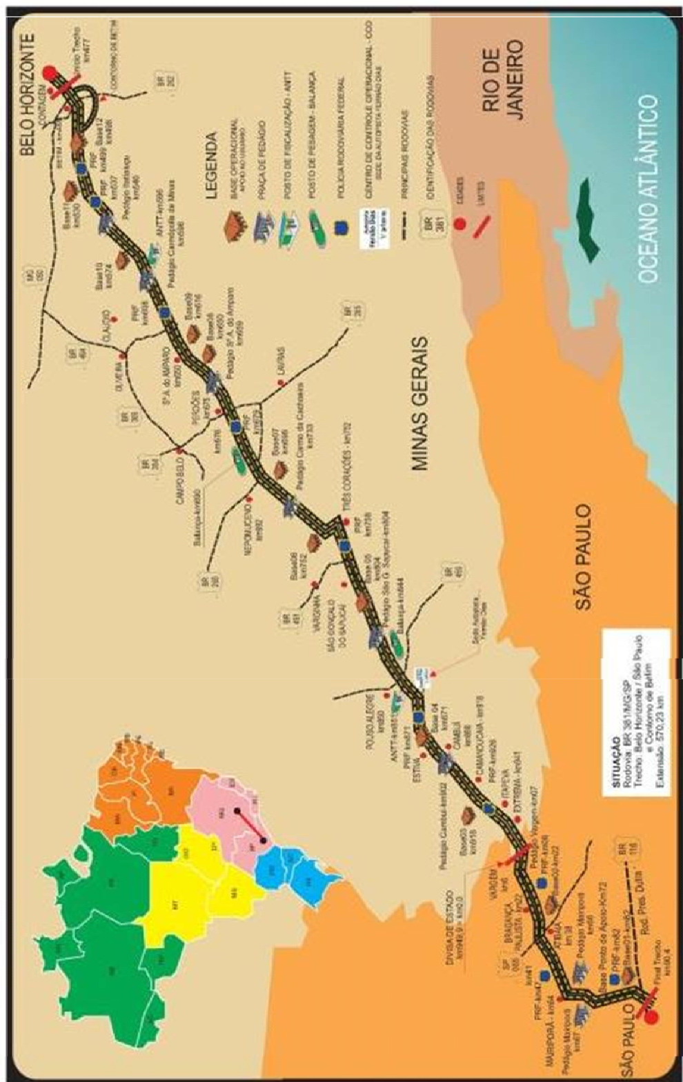
Figura 01 – Mapa de Situação