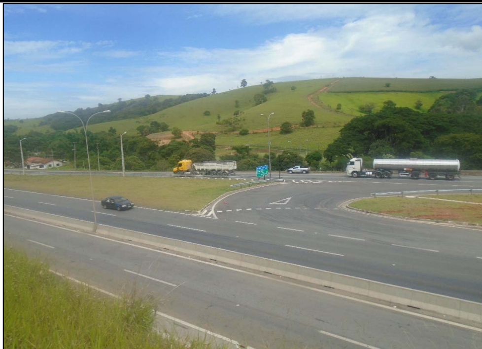
Figura 03 – Vista da obra