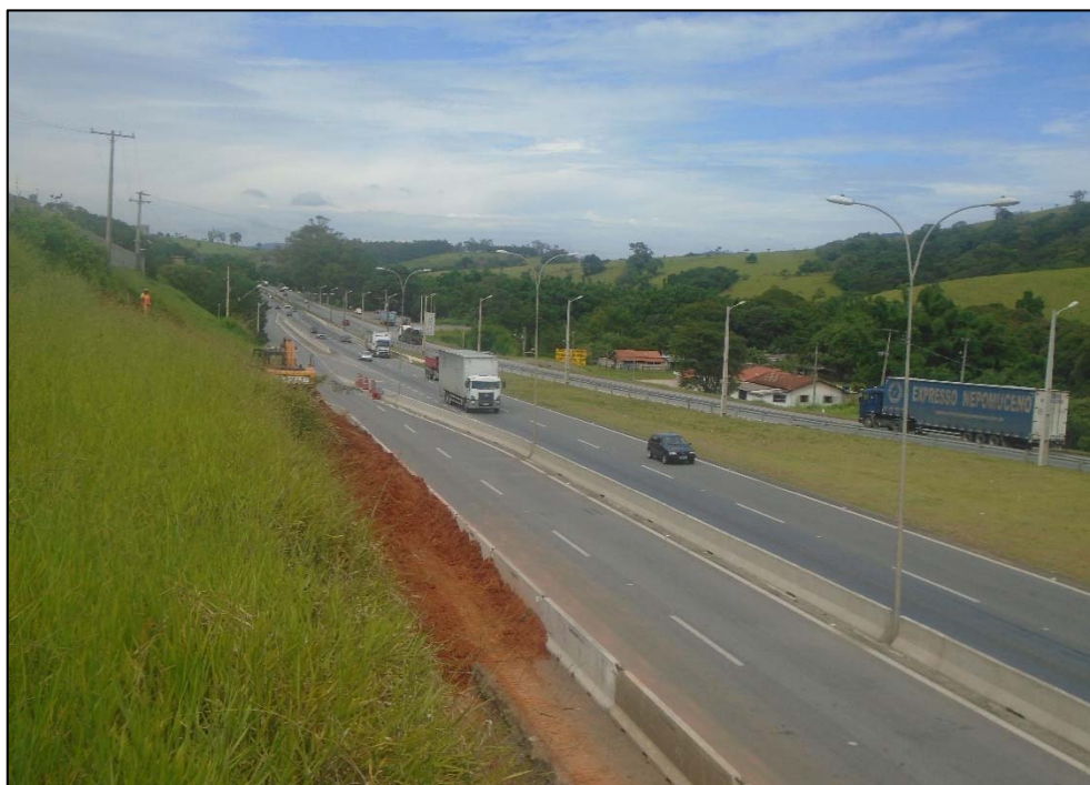
Figura 06 – Vista da obra