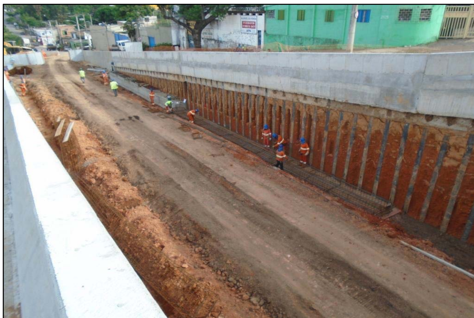
Figura 02 – Vista geral da TRP