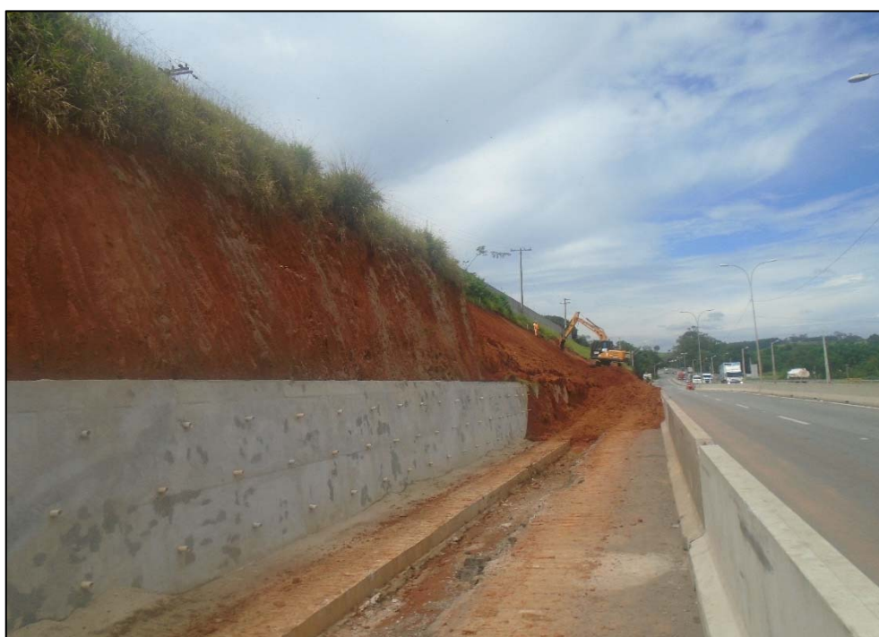
Figura 02 – Vista do muro de contenção