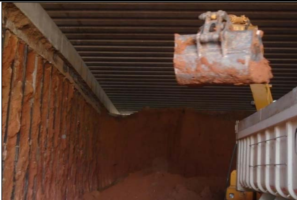
Figura 05 – TRP sob a pista de rolamento