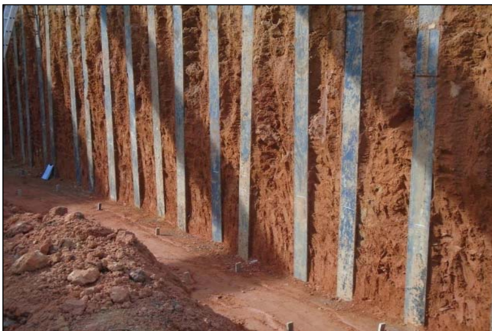
Figura 04 – Vista geral das estacas