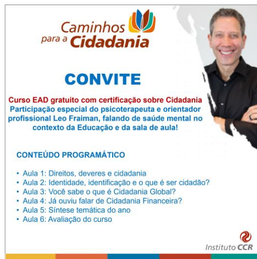
Figura 17, Projeto Caminhos para a Cidadania (Triunfo e Tio Hugo)