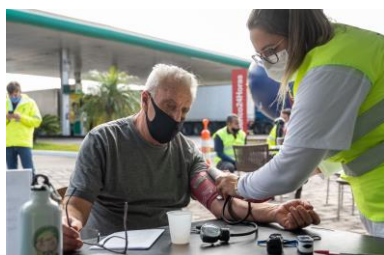
Figuras 1, 2 e 3. Estrada para a Saúde (BR-101, 04/08/21)