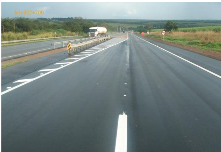
Adequação Classe I-A Km 822+700