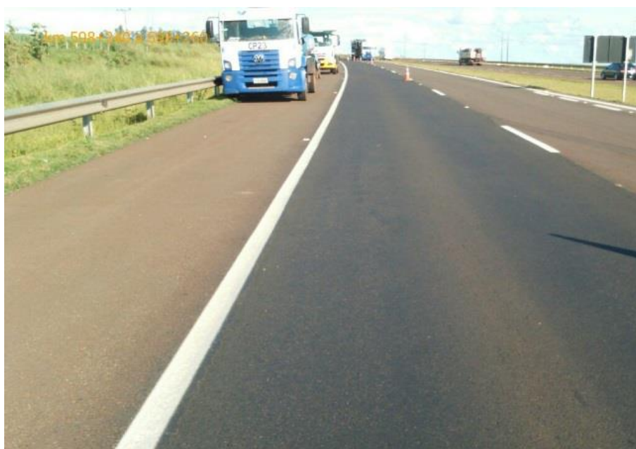
Adequação Classe I-A Km 598+500