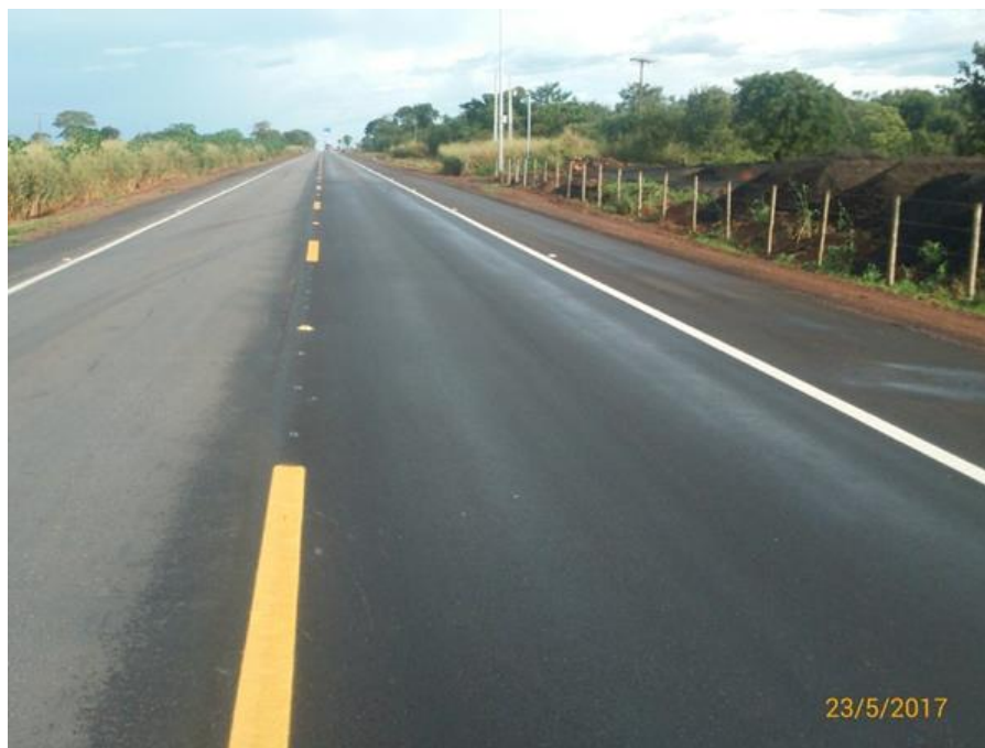
Restauração de Pavimento Km 820+160 ao Km 822+580