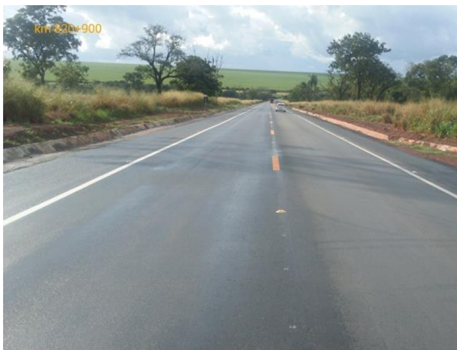
Restauração de Pavimento Km 820+160 ao Km 822+580