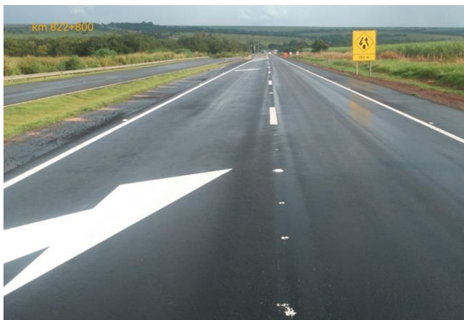
Adequação Classe I-A Km 822+800