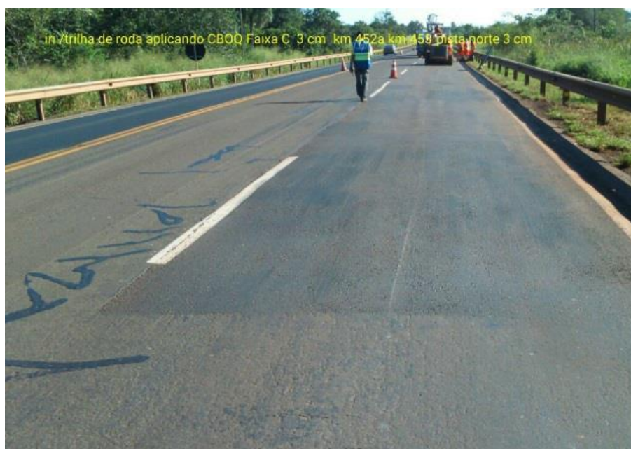
Adequação Classe I-A Km 452+000 ao Km 453+000