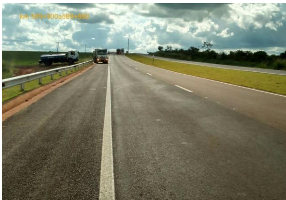
Adequação Classe I-A Km 589+800