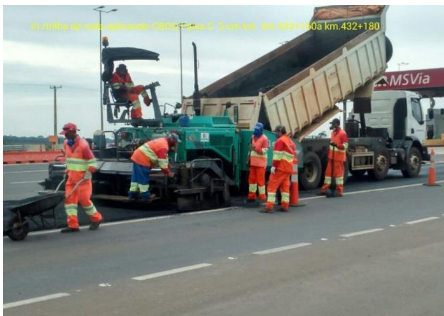
Adequação Classe I-A Km 432+180