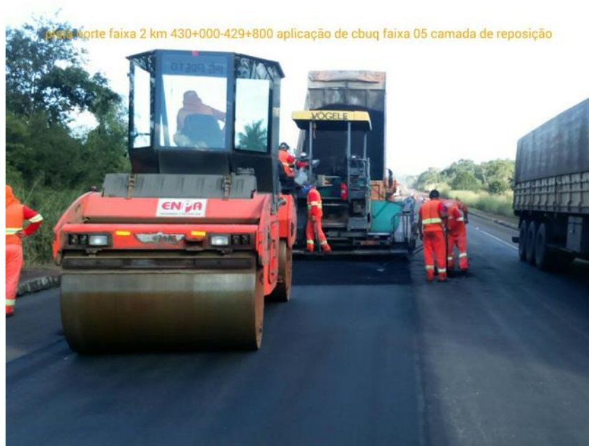
Fresagem e Recomposição Km 429+800 ao Km 430+000