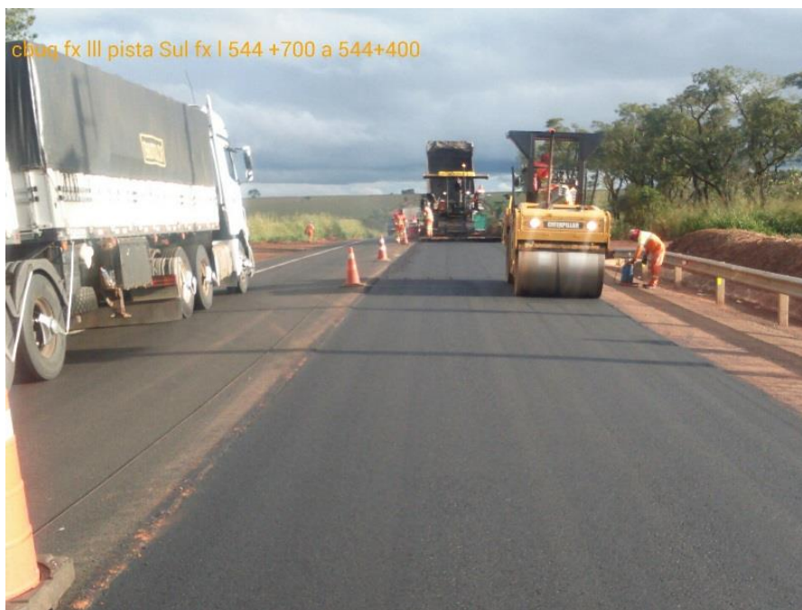
Fresagem e Recomposição Km 543+300 ao Km 545+800