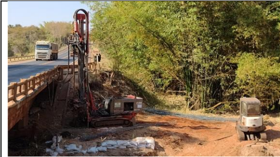
Km 56+500 – Perfuração estaca raiz