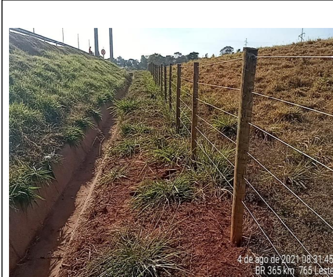
Km 765+00 Leste - Roçada