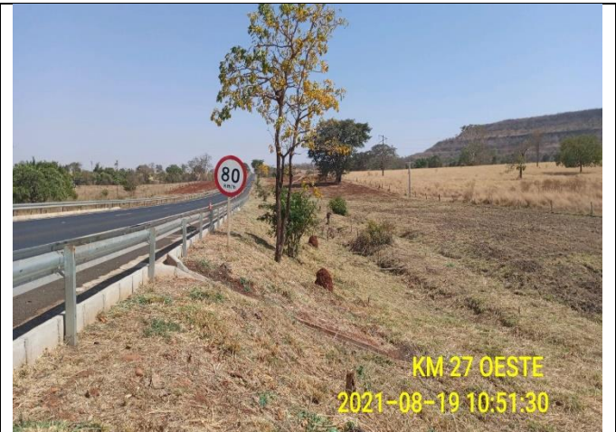
Km 27+000 Oeste - Roçada