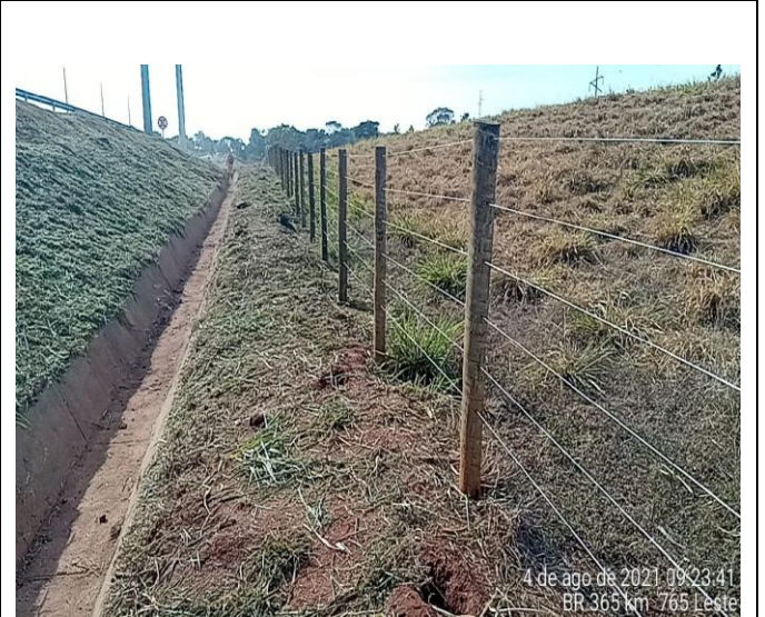
Km 765+00 Leste - Roçada