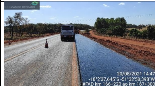
Faixa adicional km 166+220 ao 167+300