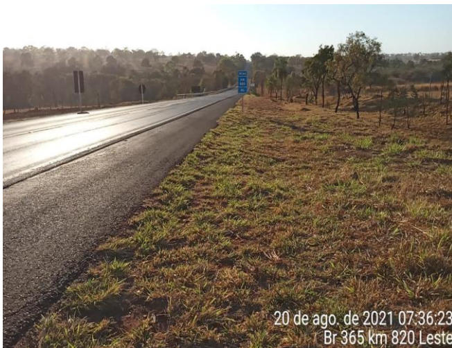
Km 820+000 Leste - Roçada