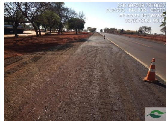
Acesso - Km 810+220