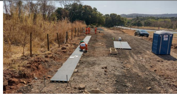
Km 56+500 – Execução de berço para