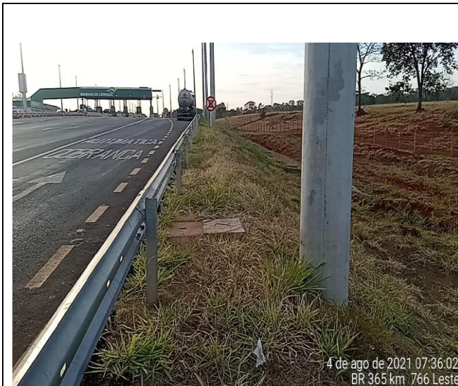
Km 766+00 Leste - Roçada