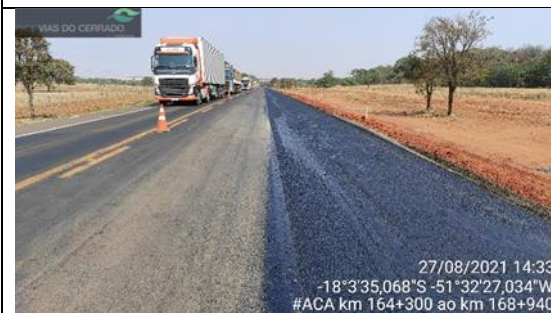
Adequação de acostamento km 164+300 ao 169+340