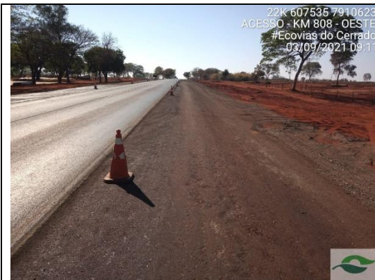
Acesso - Km 810+220