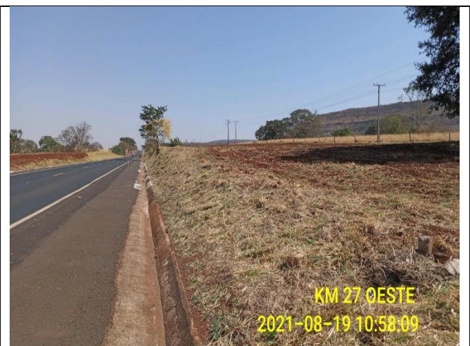
Km 27+000 Oeste - Roçada