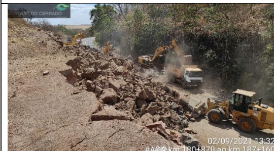
Adequação de acostamento km 180+870 ao 187+160