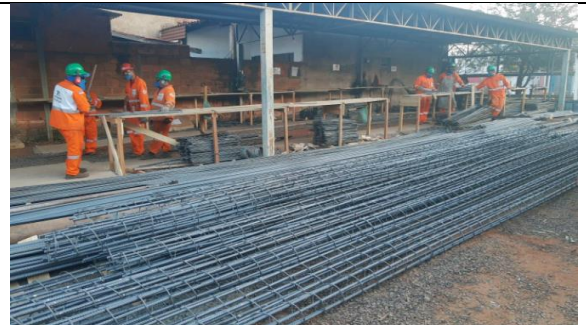
Km 56+500 – montagem de viga