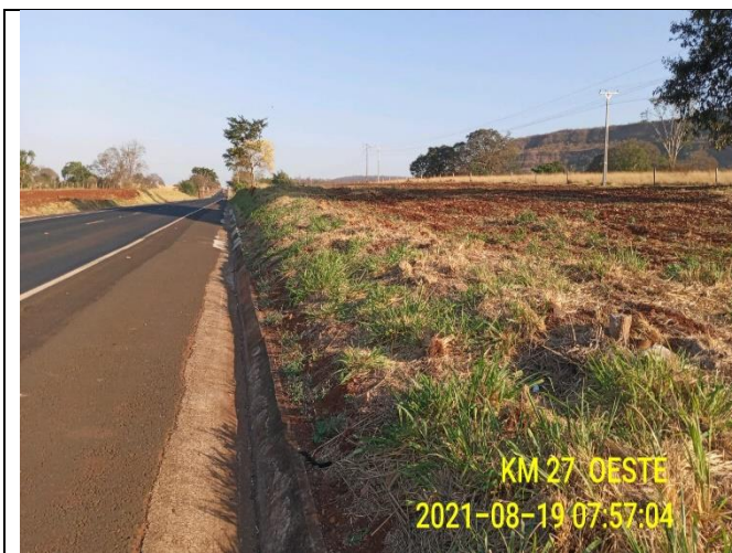
Km 27+000 Oeste - Roçada