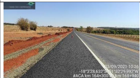
Adequação de acostamento km 164+300 ao 169+340