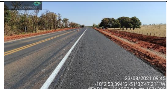
Faixa adicional km 166+220 ao 167+300