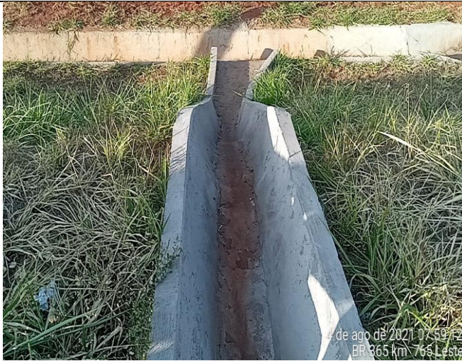
Km 765+000 Leste - Limpeza de drenagem