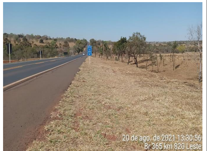
Km 820+000 Leste - Roçada