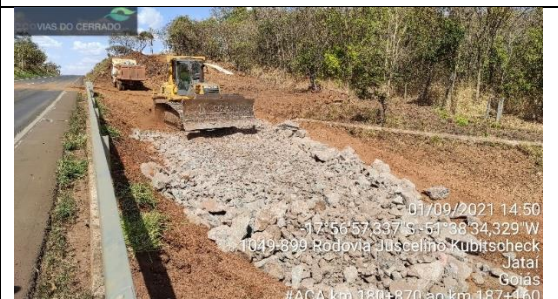
Adequação de acostamento km 180+870 ao 187+160