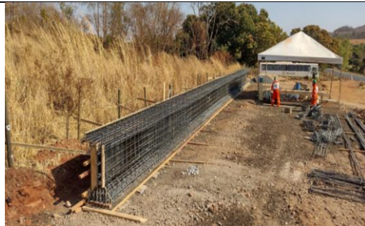
Km 56+500 – montagem de viga