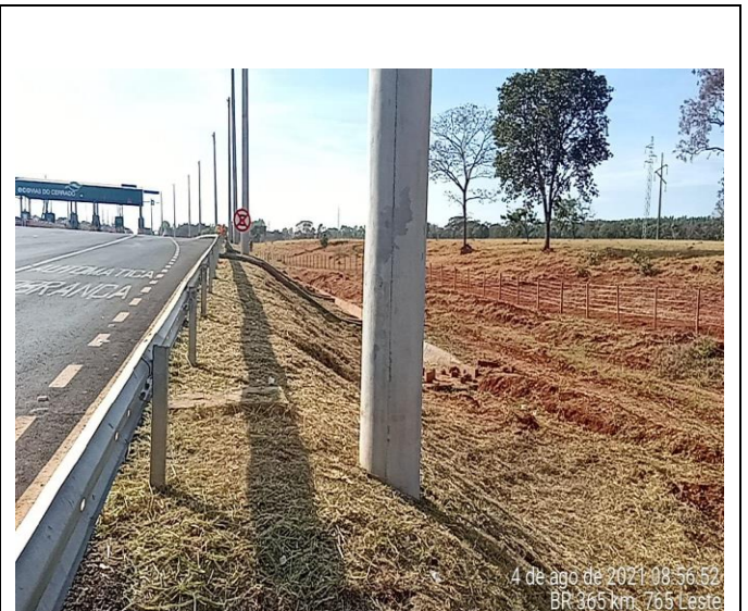
Km 766+00 Leste - Roçada