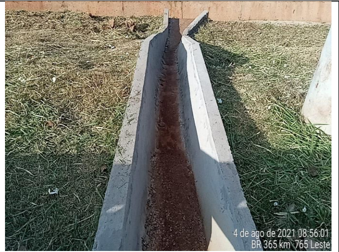
Km 765+000 Leste - Limpeza de drenagem