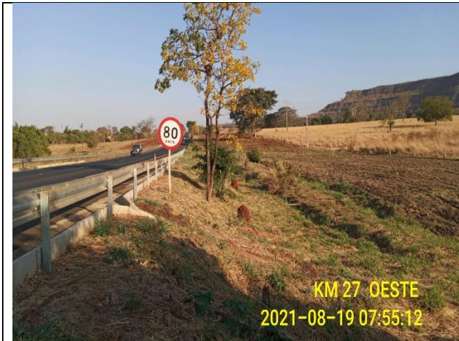
Km 27+000 Oeste - Roçada