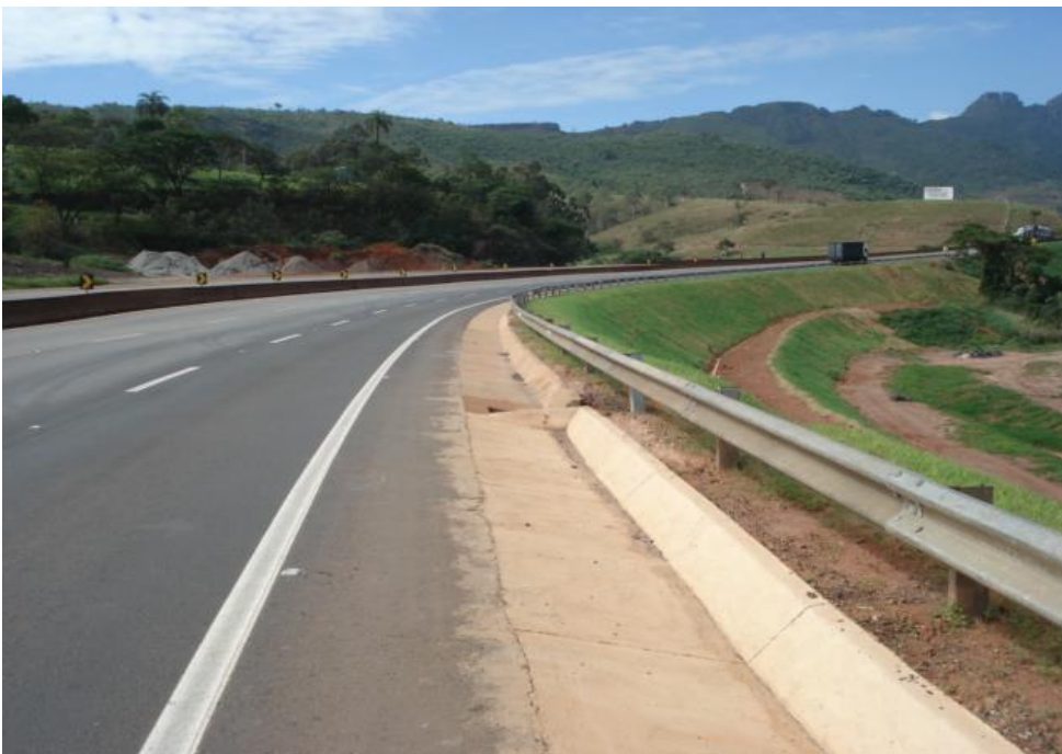
Figura 02 – vista geral – obra concluída