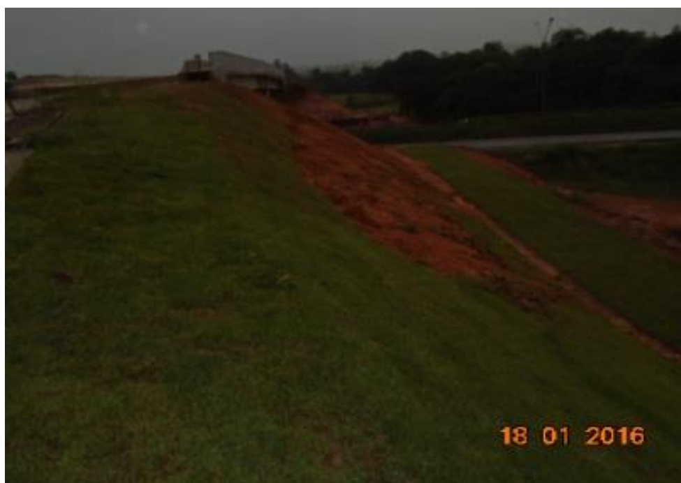
Figura 06 – detalhe da terraplenagem