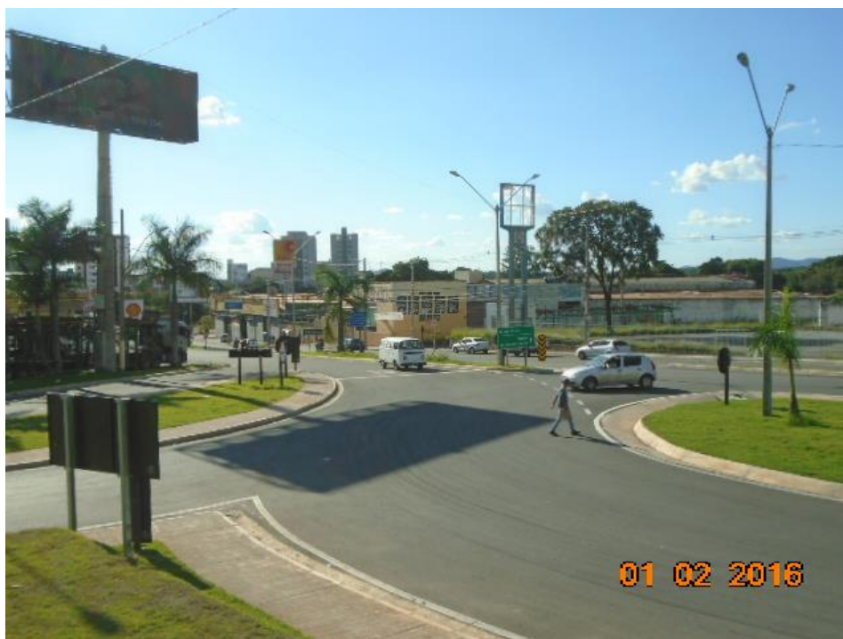
Figura 03 – vista parcial – obra concluída