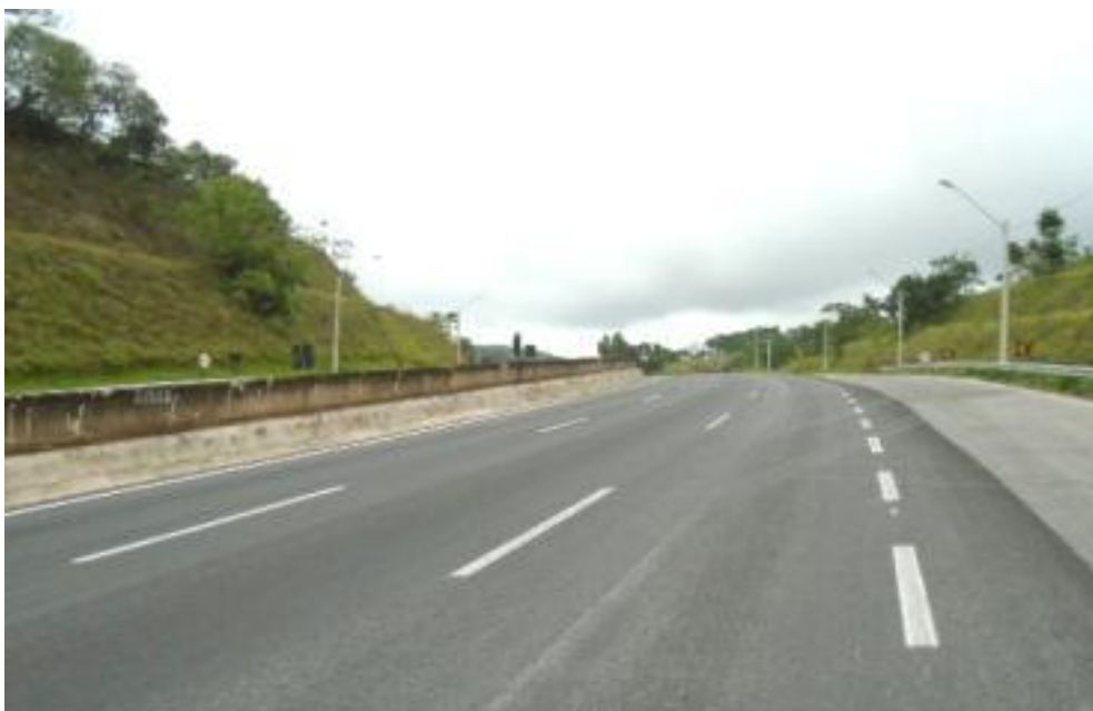
Figura 03 – aplicação de microrevestimento