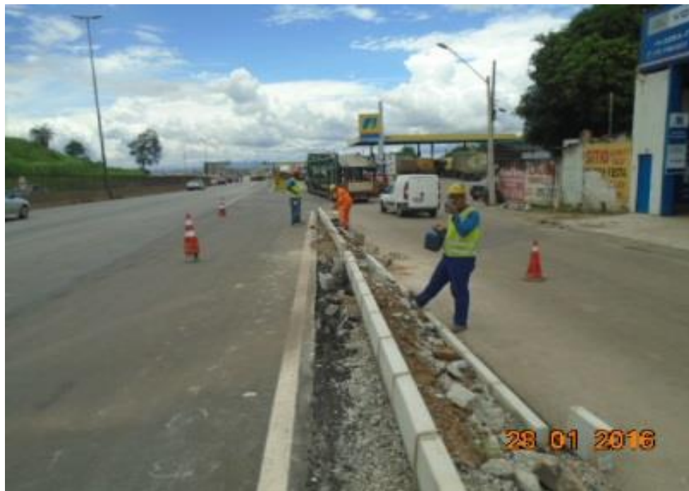
Figura 06 – implantação de meio fio