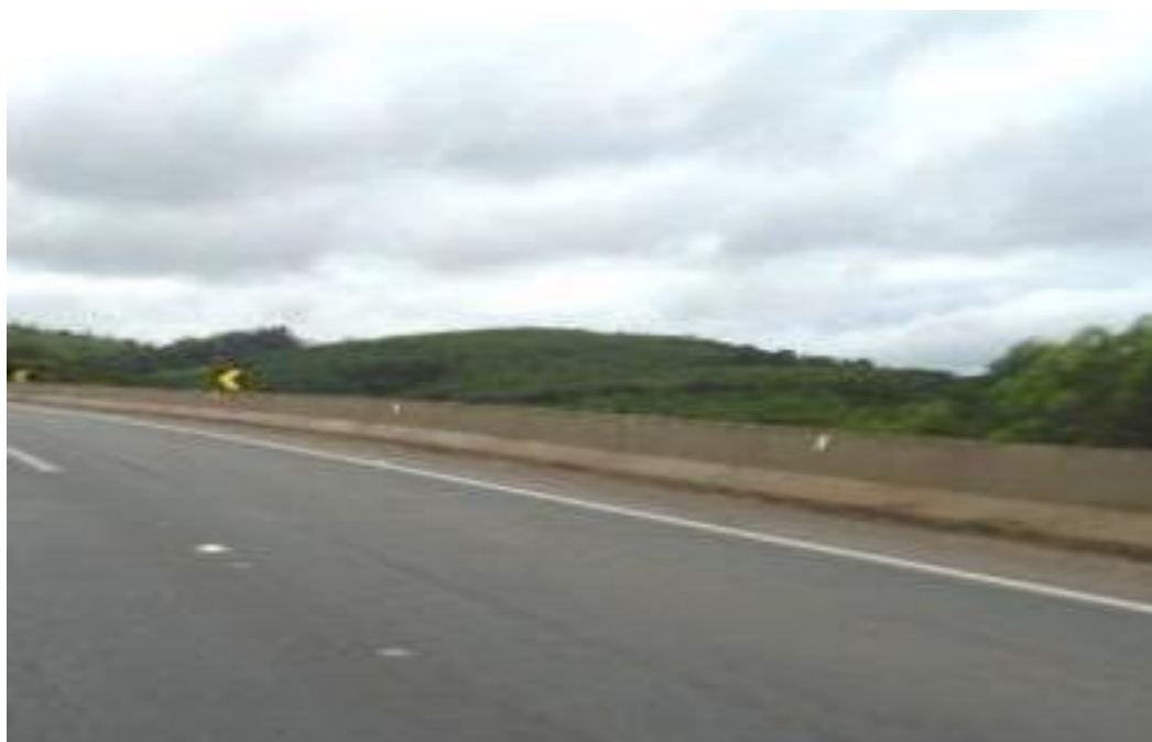
Figura 06 – aplicação de microrevestimento