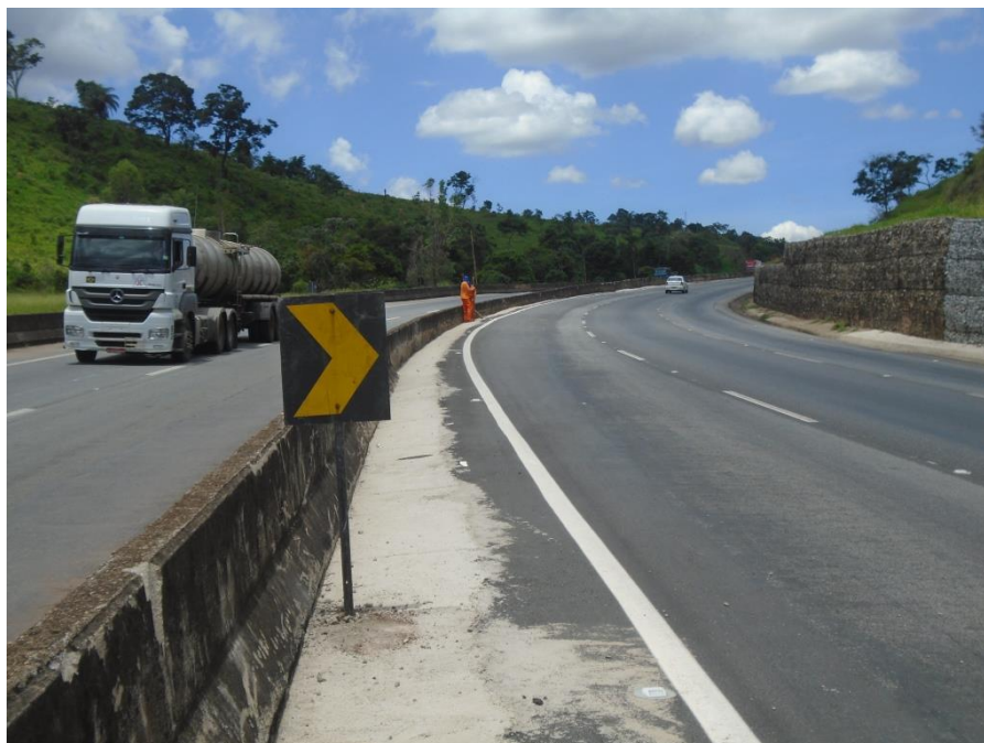
Figura 01 – execução de fresagem estrutural