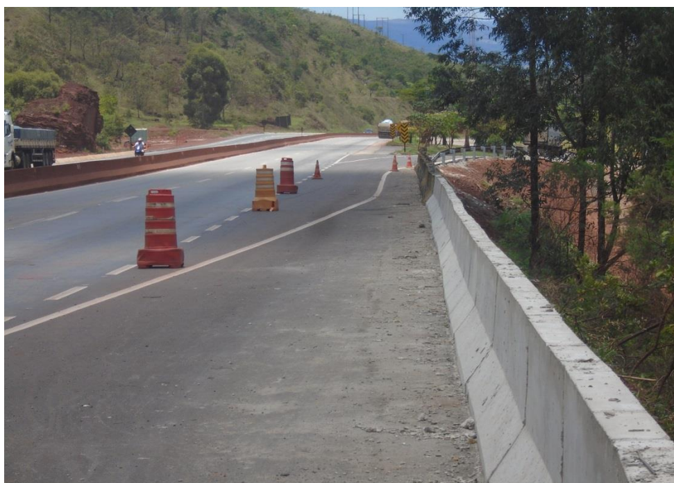
Figura 04 – execução de barreiras new jersey