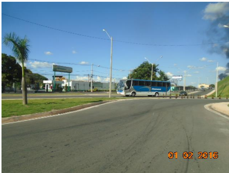
Figura 01 – vista parcial – obra concluída