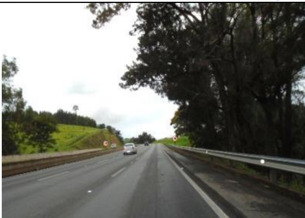
Figura 05 – aplicação de microrevestimento