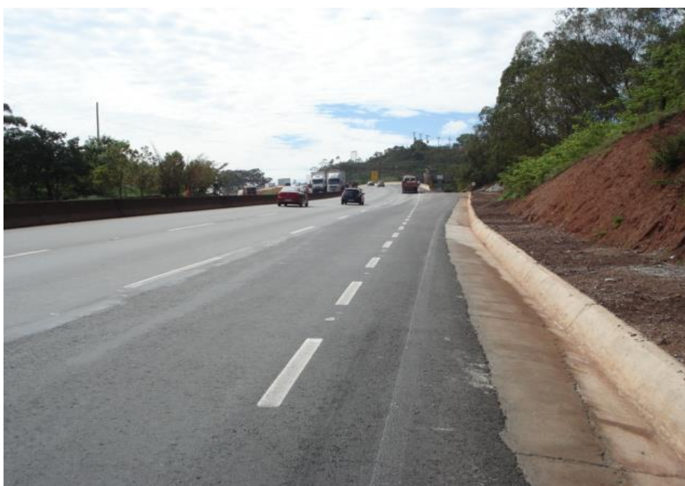
Figura 06 – vista geral – obra concluída