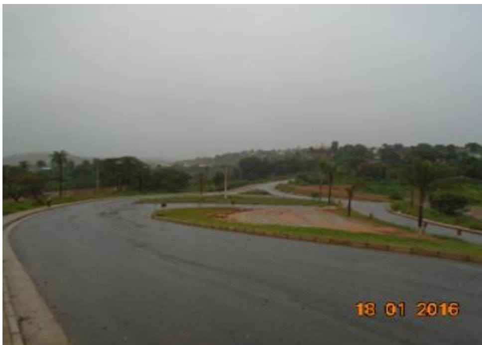
Figura 03 – imprimação da alça de acesso