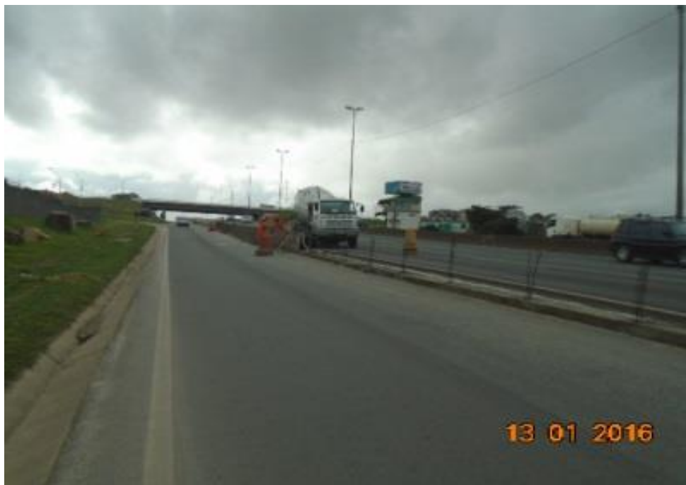
Figura 01 – execução de barreira New Jersey