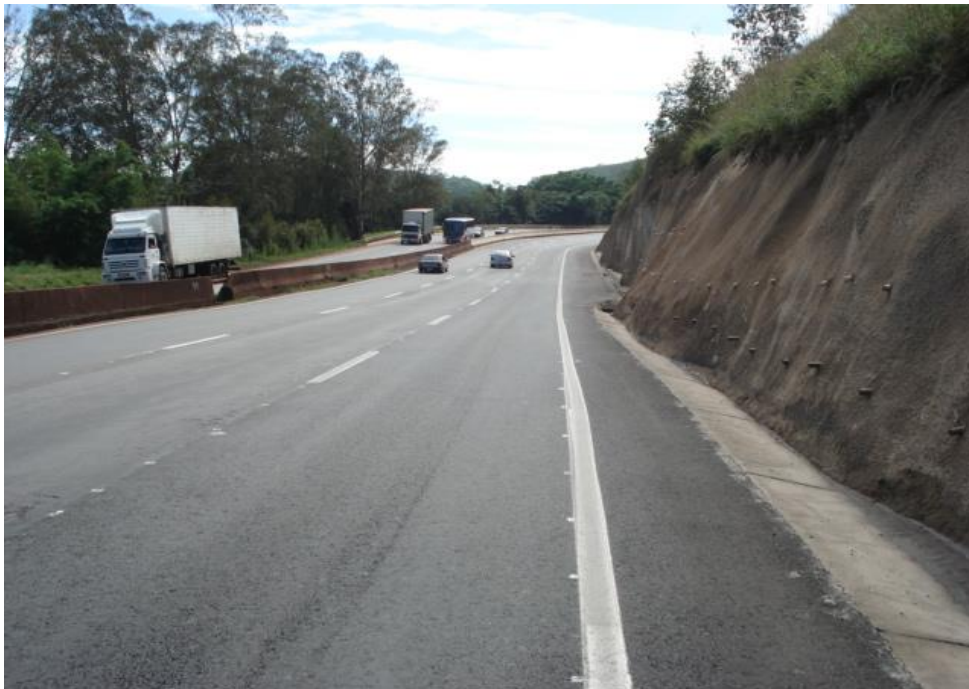
Figura 01 – vista geral – obra concluída