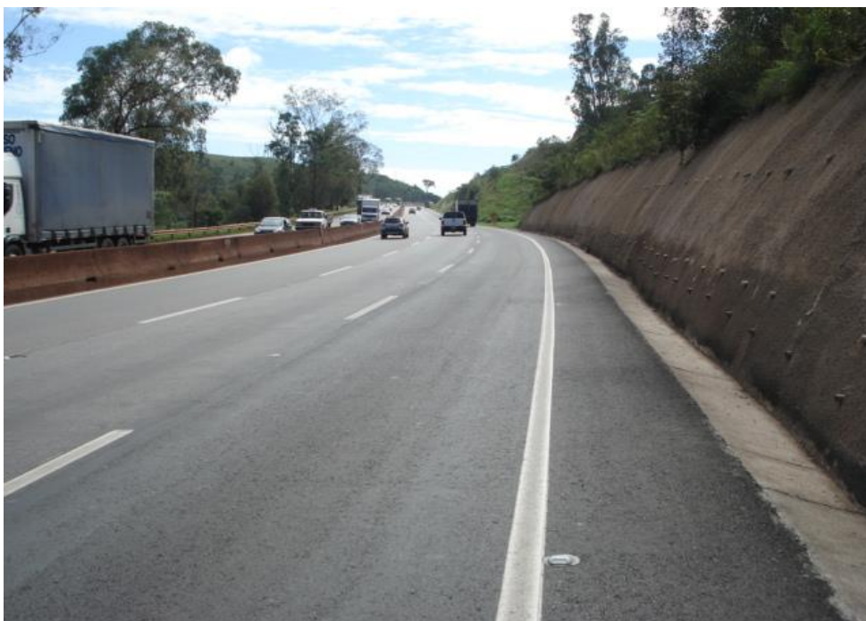
Figura 04 – vista geral – obra concluída