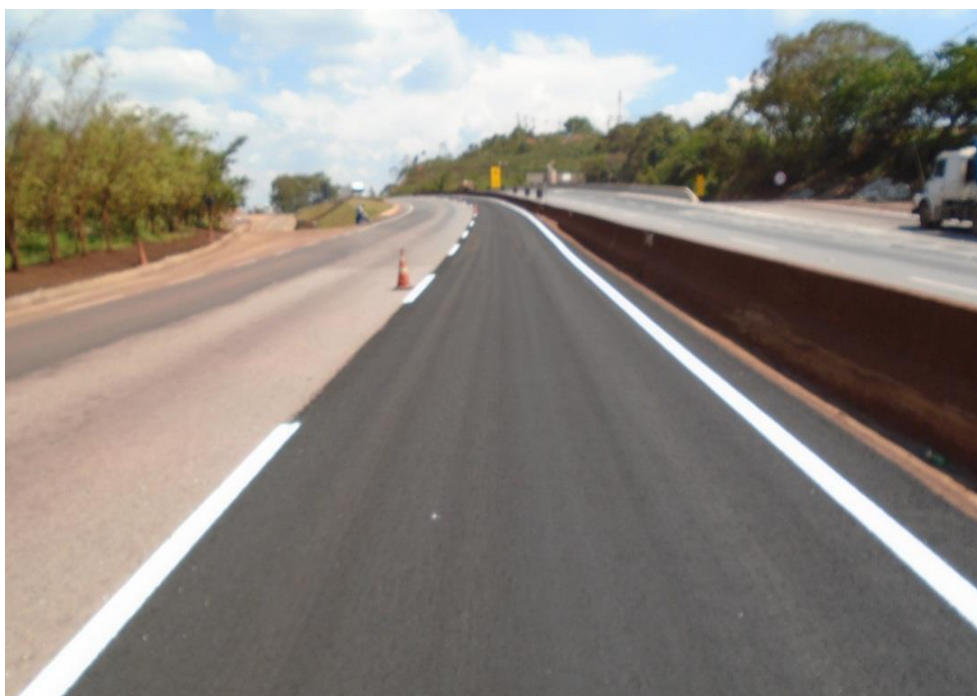
Figura 02 – aplicação de microrevestimento