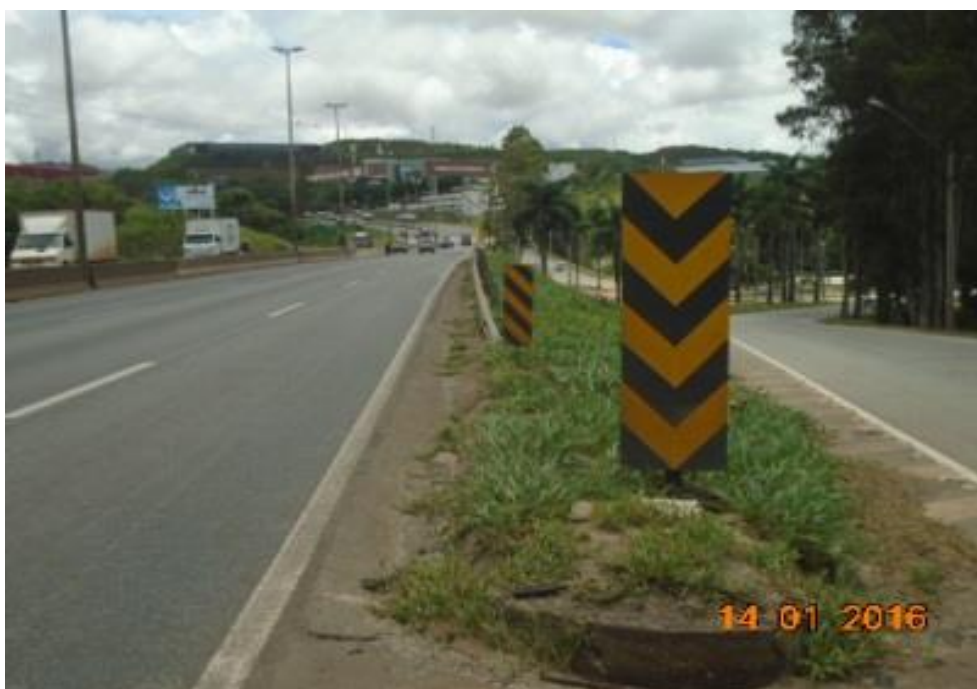
Figura 04 – implantação de sinalização horizontal