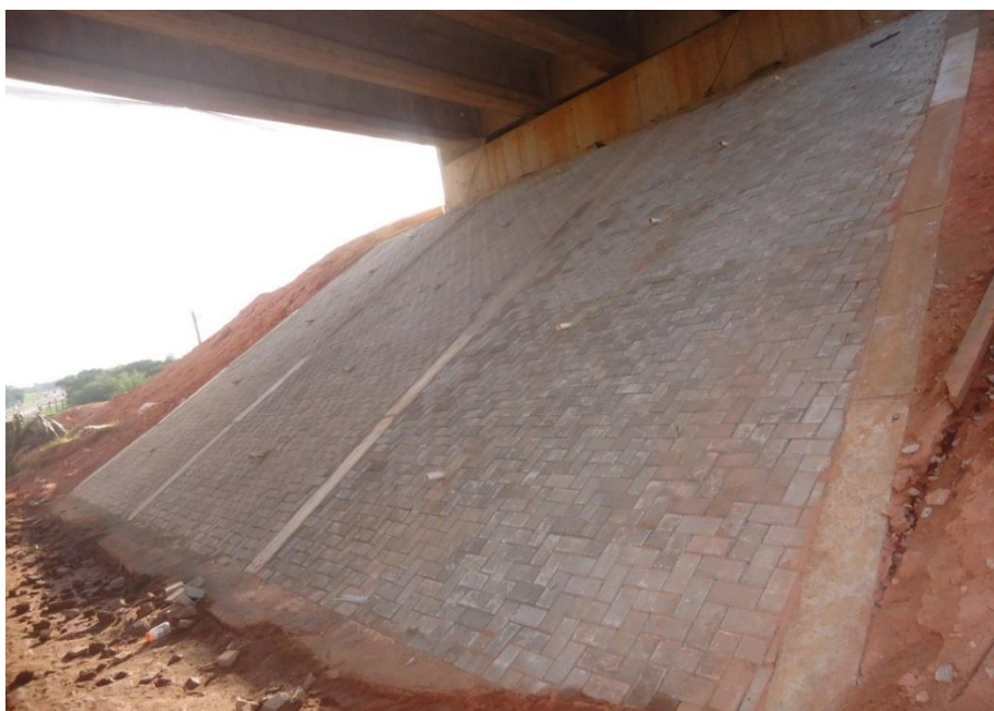
Figura 01 – revestimento de concreto intertravado