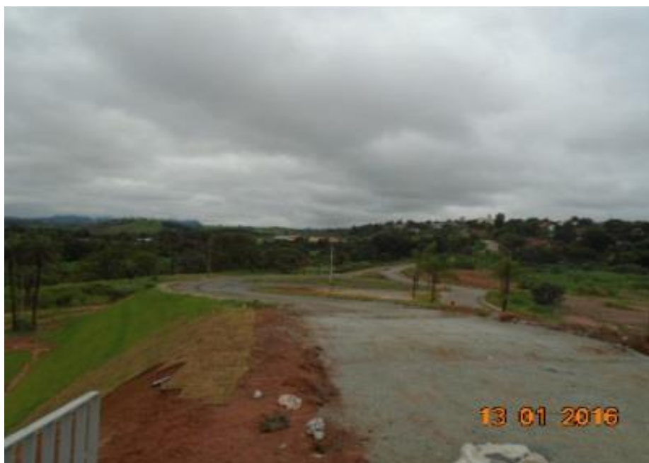
Figura 02 – execução de base em alça