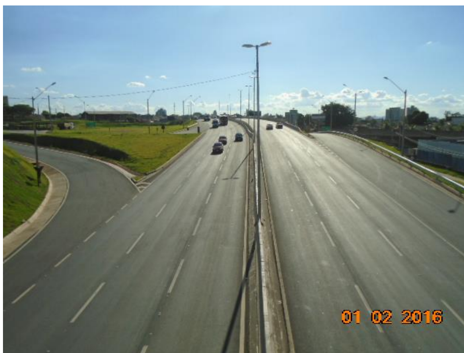
Figura 06 – vista parcial – obra concluída