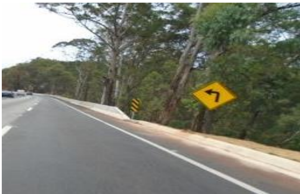
Figura 06 – implantação de sinalização vertical