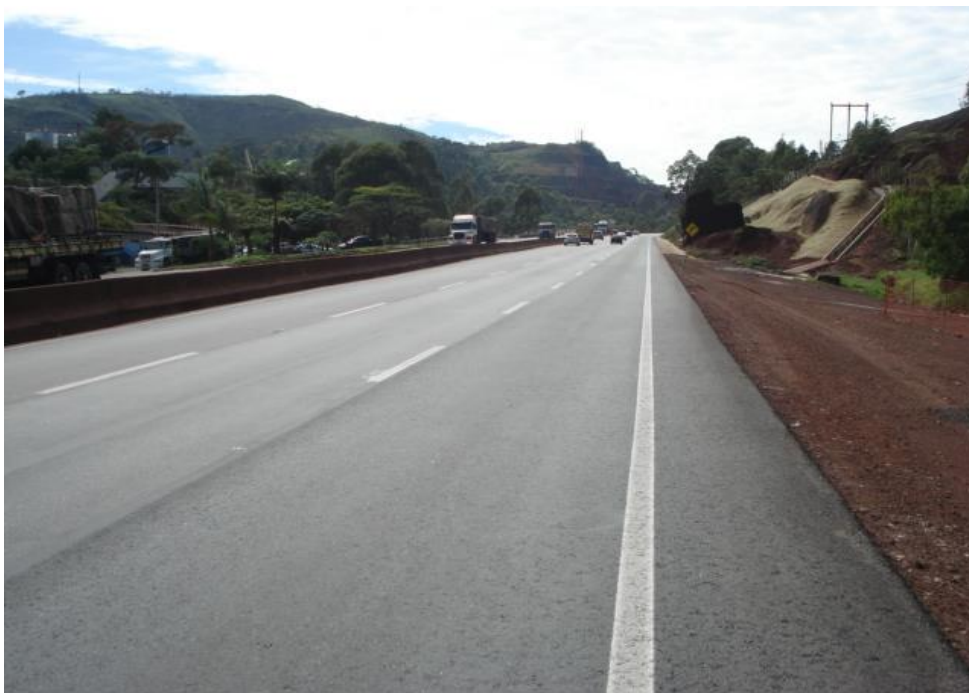
Figura 03 – vista geral – obra concluída