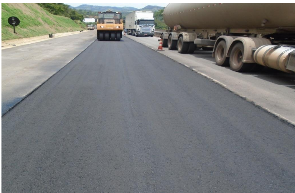
Figura 04 – aplicação de CBUQ