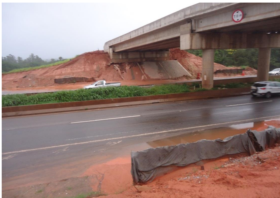
Figura 05 – vista inferior da obra