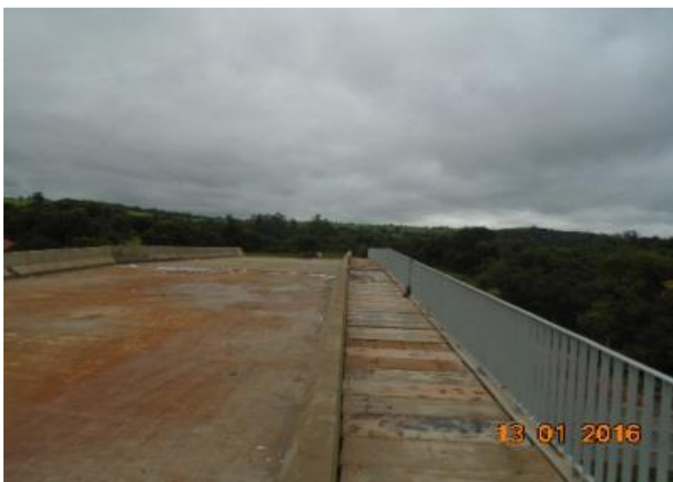
Figura 04 – execução de passeio e implantação de gradil