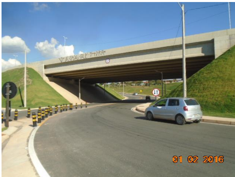
Figura 05 – vista parcial – obra concluída