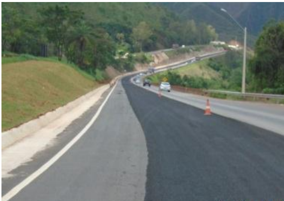
Figura 01 – aplicação de microrevestimento