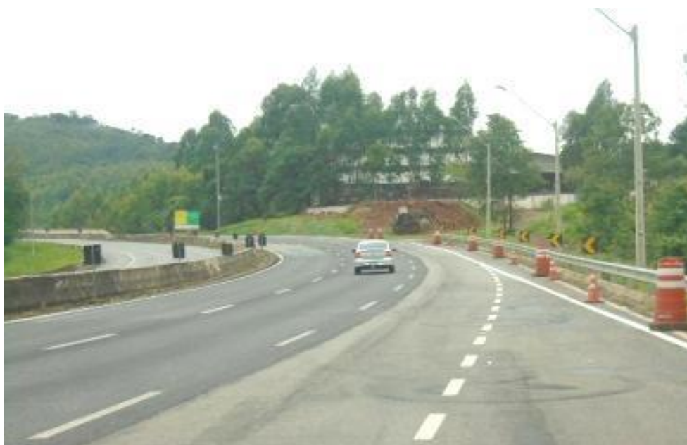
Figura 02 – implantação de sinalização vertical