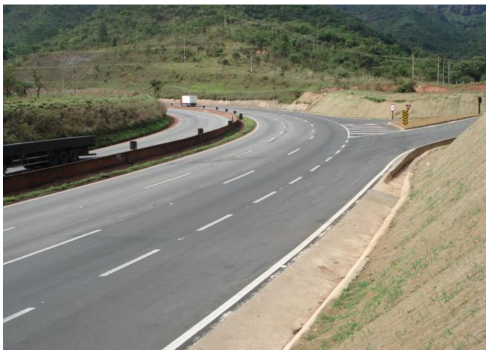
Figura 05 – vista geral – obra concluída