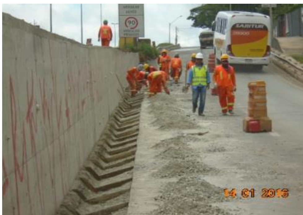
Figura 02 – execução de drenagem superficial