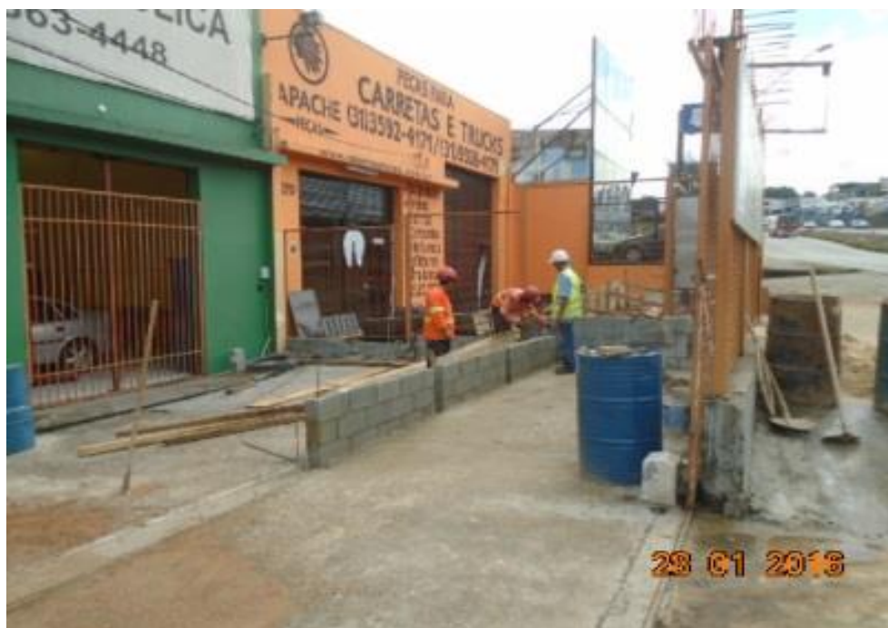
Figura 05 – remanejamento de muro de limite de faixa de domínio