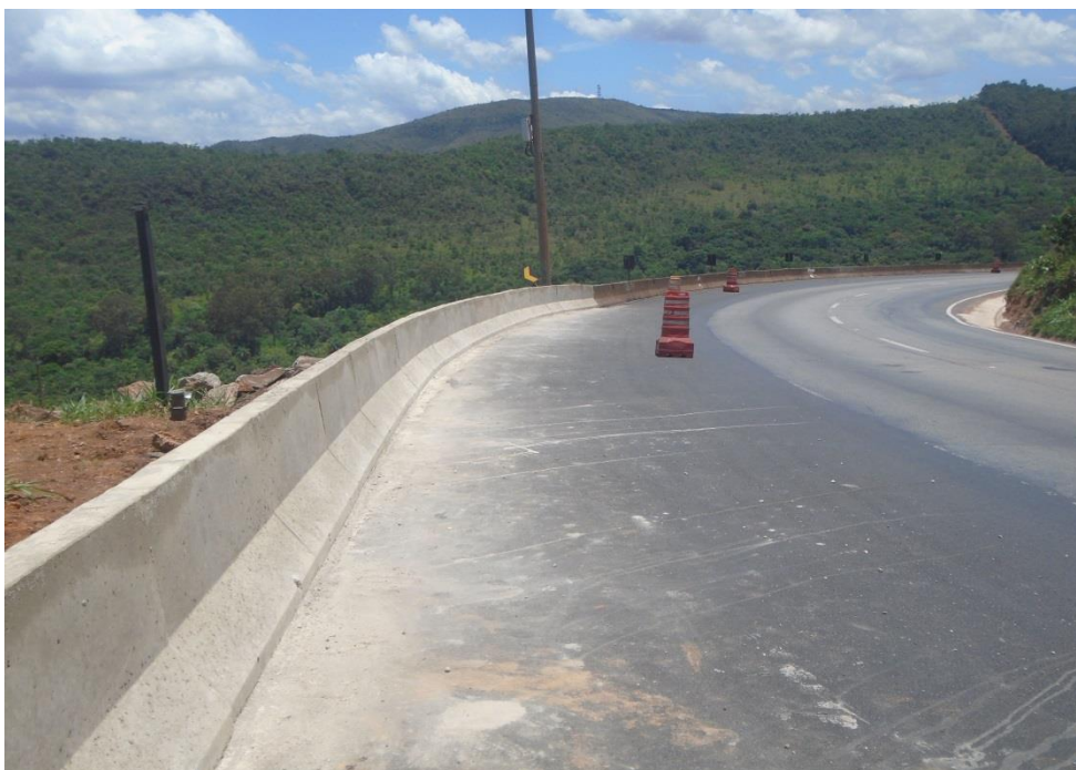
Figura 03 – execução de barreiras new jersey