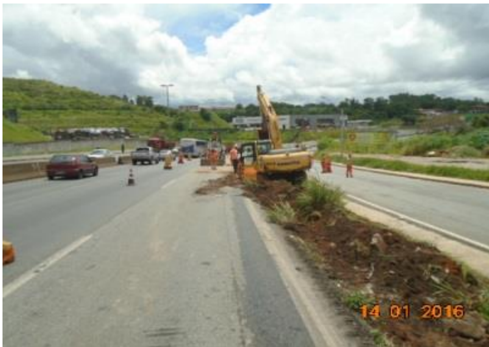
Figura 03 – escavação no canteiro lateral para implantação da 3ª faixa