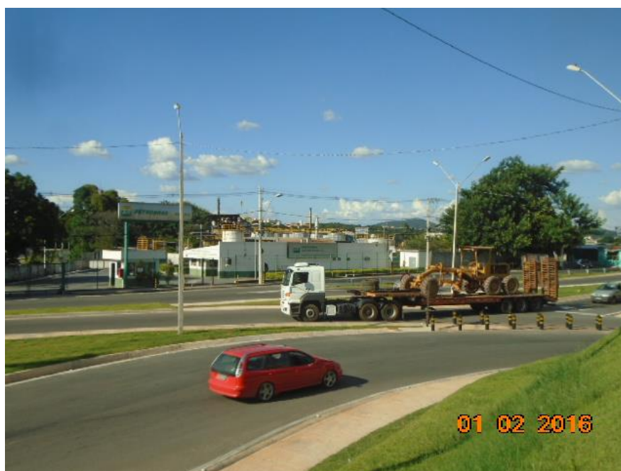
Figura 02 – vista parcial – obra concluída