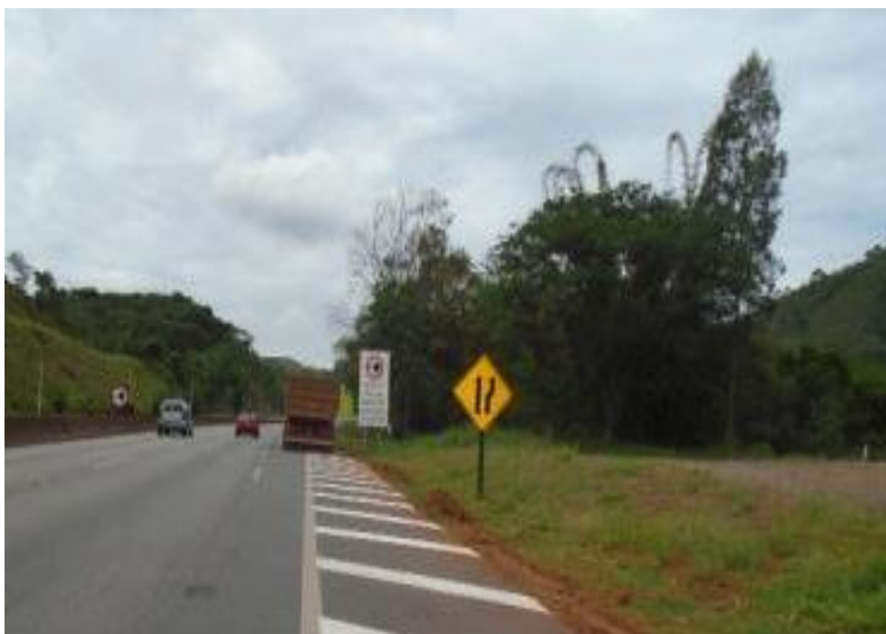
Figura 05 – implantação de sinalização vertical