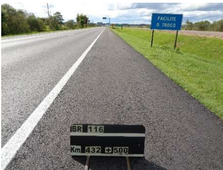
Figura 03 – Recomposição de acostamentos BR-116 km 432+500