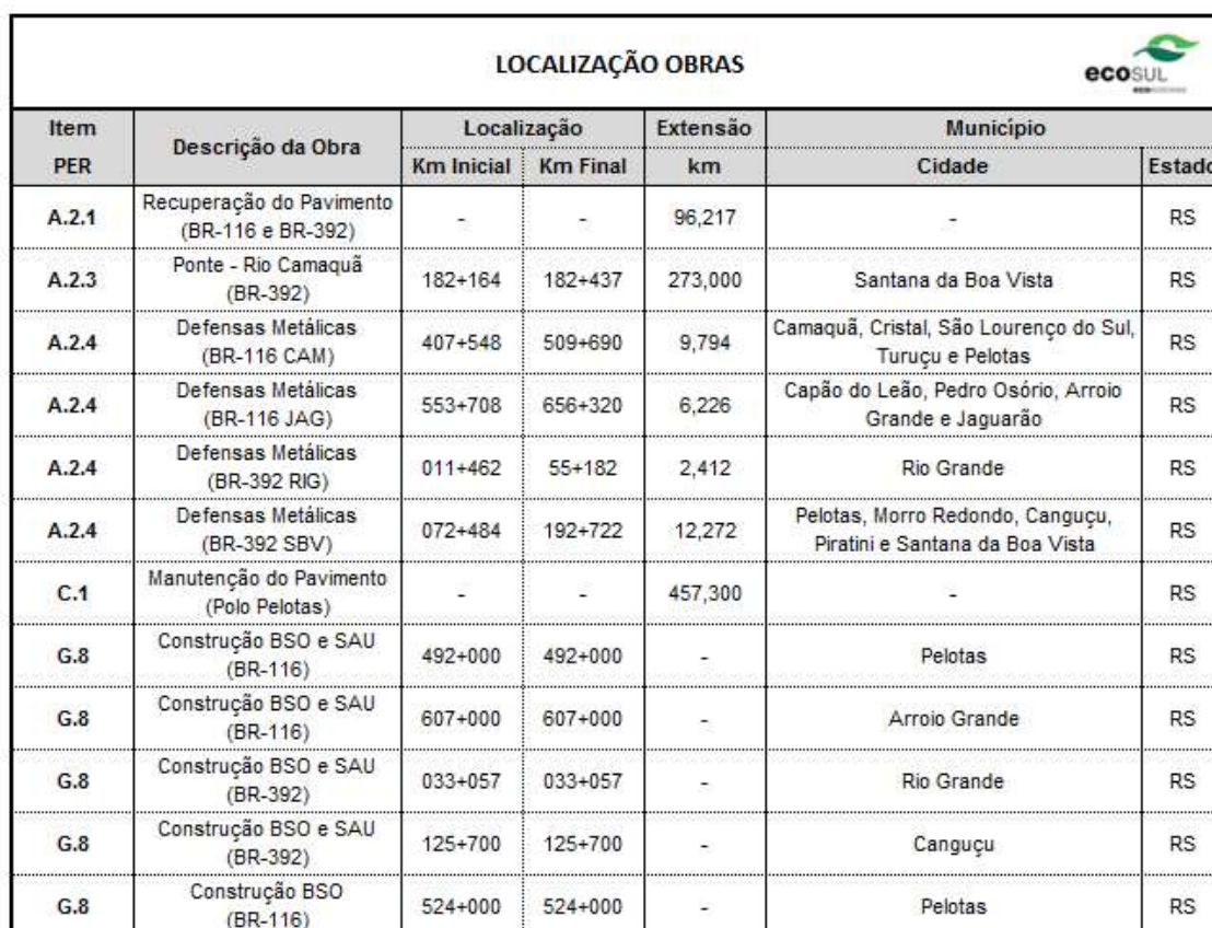
Tabela 02 – Relação das Principais Obras