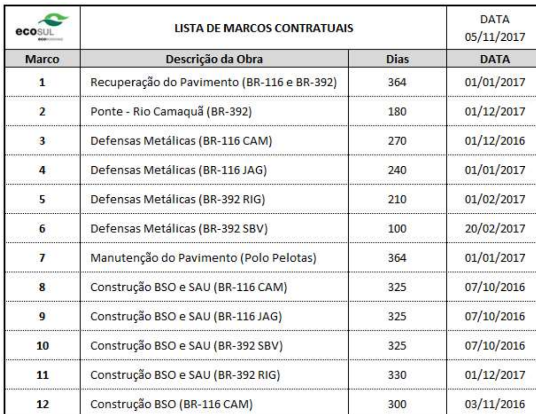
Tabela 03 – Lista de Marcos Contratuais