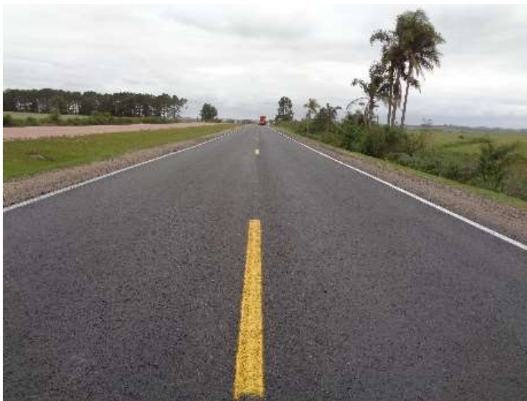
Figura 02 – Serviços de recuperação do pavimento BR-116 km 443+000 ao km 452+900