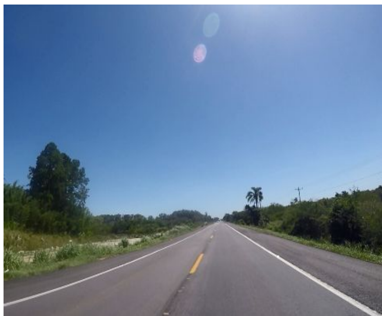
Figura 03 – Manutenção do Pavimento – BR-116/RS