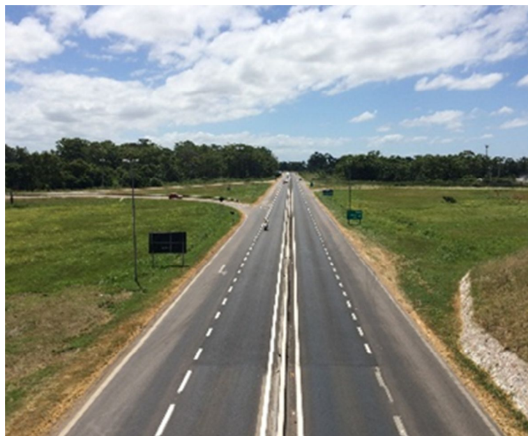
Figura 02 – Recuperação do Pavimento – BR-392/RS