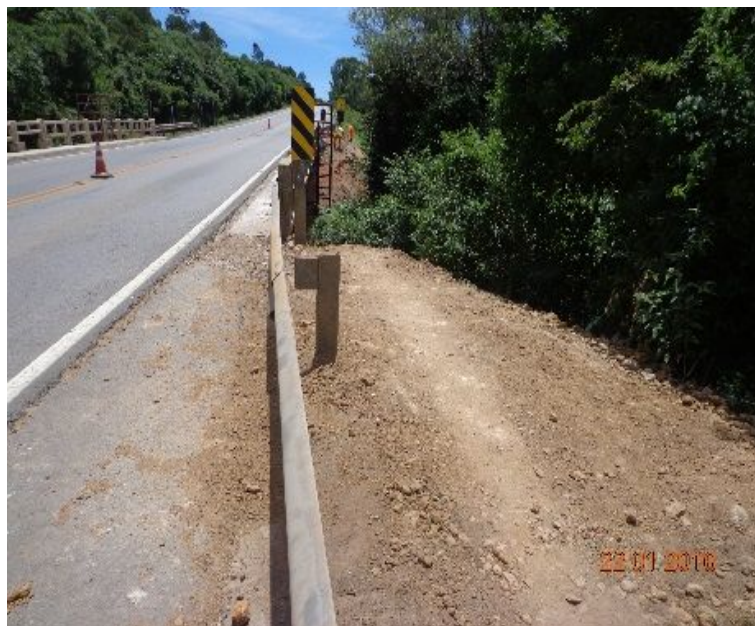
Figura 04 – Recuperação Estrutural Ponte Sobre o Rio Canguçu – BR-392/RS