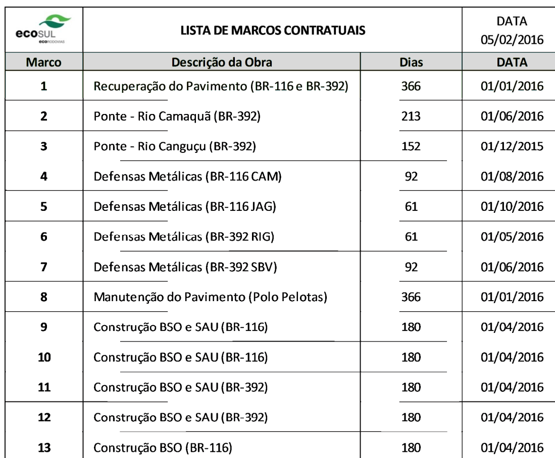
Tabela 03 – Lista de Marcos Contratuais