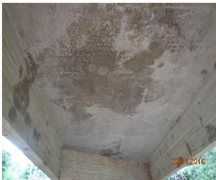
Figura 05 – Recuperação Estrutural Ponte Sobre o Rio Canguçu – BR-392/RS