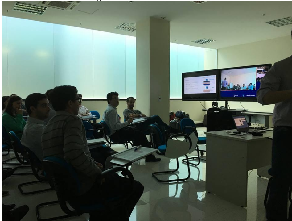
Figura 4 – Vídeo conferência